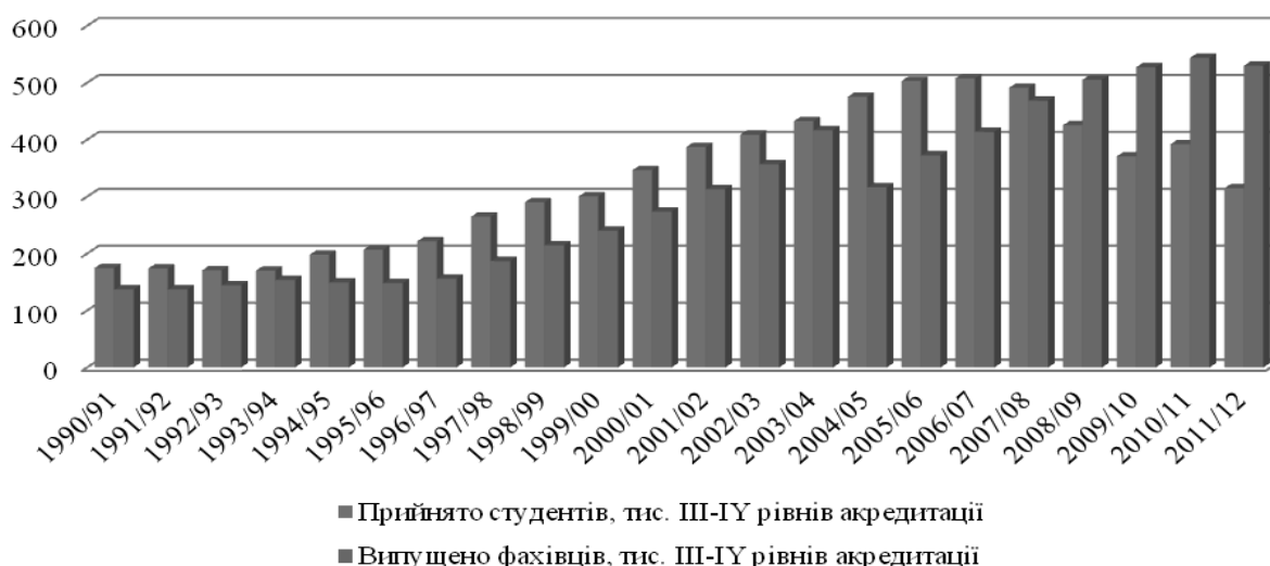
Рис. 4. Кількість прийнятих студентів та випущених фахівців вищих навчальних закладів III-IV рівнів акредитації за 1991–2011 рр.*