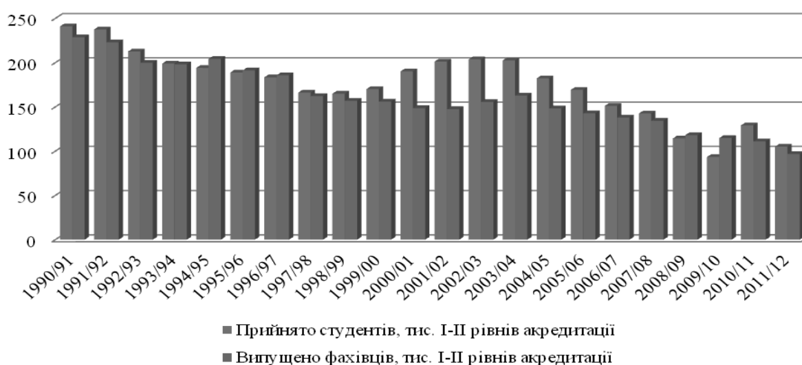
Рис. 3. Кількість прийнятих студентів та випущених фахівців вищих навчальних закладів I–II рівнів акредитації за 1991–2011 р.*

зменшення чисельності випускників середніх шкіл на 5 тис. у зв'язку з цим скоротилась і кількість студентів, в основному, на вечірній та заочній формі навчання. Можна спрогнозувати, що скорочення кількості випускників середніх шкіл буде щорічно складати 10% протягом найближчих 5 років (лише з 2020 р. кількість випускників шкіл почне зростати щорічно на 2%). Демографічна криза не може не відобразитися на структурі вищої школи в цілому і на підвищенні ступеня конкурентоспроможності вищих навчальних закладів.