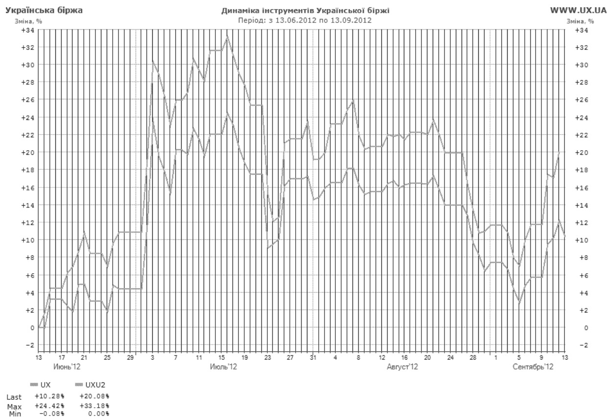
Рис. 2. Динаміка індексу UX та ф'ючерсного контракту на цей індекс за період з 13.06 до 13.09.2012 р.

індексу, що свідчить про достатньо високий фаховий рівень учасників торгівлі, які торгують цим фінансовим інструментом.