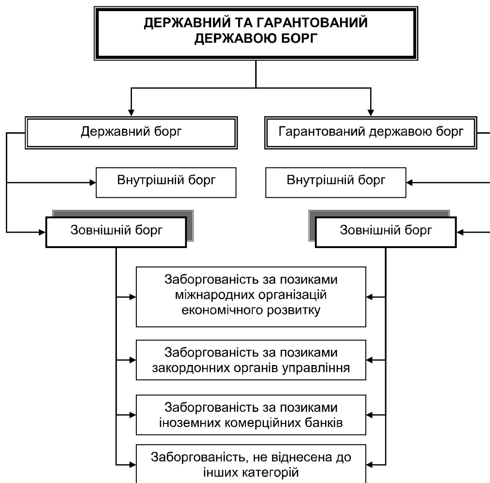
Рис. 1. Класифікація державного боргу та зовнішніх запозичень

Борг держави поділяється на державний борг і гарантований державою борг .