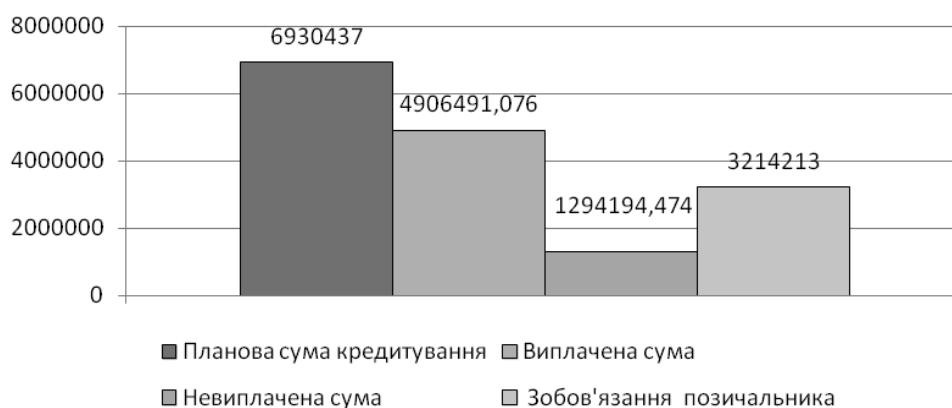
Рис. 2. Кредитування України Світовим банком станом на 31.05.2012 р., тис. дол. США*

Таким чином, кредити розподіляють достатньо рівномірно за чотирма основними напрямками. Причому, 30%, максимальна частка, спрямовуються на фінансуван-