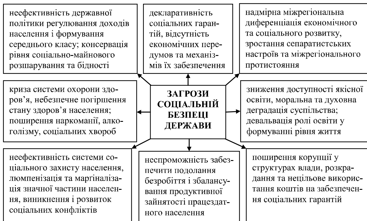
Рис. 2. Загрози соціальній безпеці держави, спричинені недоліками функціонування системи соціальних гарантій*

Зазвичай, порогові значення індикаторів соціальної безпеки визначають на підставі спеціальних багаторічних досліджень [2] та оцінювання досягнутих результатів минулих періодів [27]. При цьому важливо оптимізувати склад показників для уникнення ускладнень при плануванні та управлінні. Агрегація критеріальних показників соціальної безпеки може проводитися шляхом визначення укрупнених індексів із використанням економіко-математичних розрахунків (аж до виведення інтегрального індексу соціальної безпеки), методами