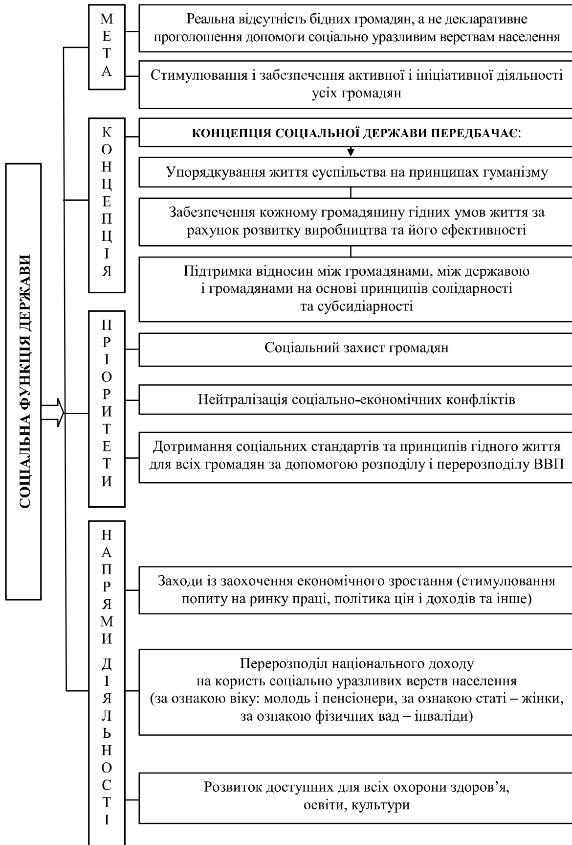
Рис. 1. Змістове наповнення соціальної функції держави