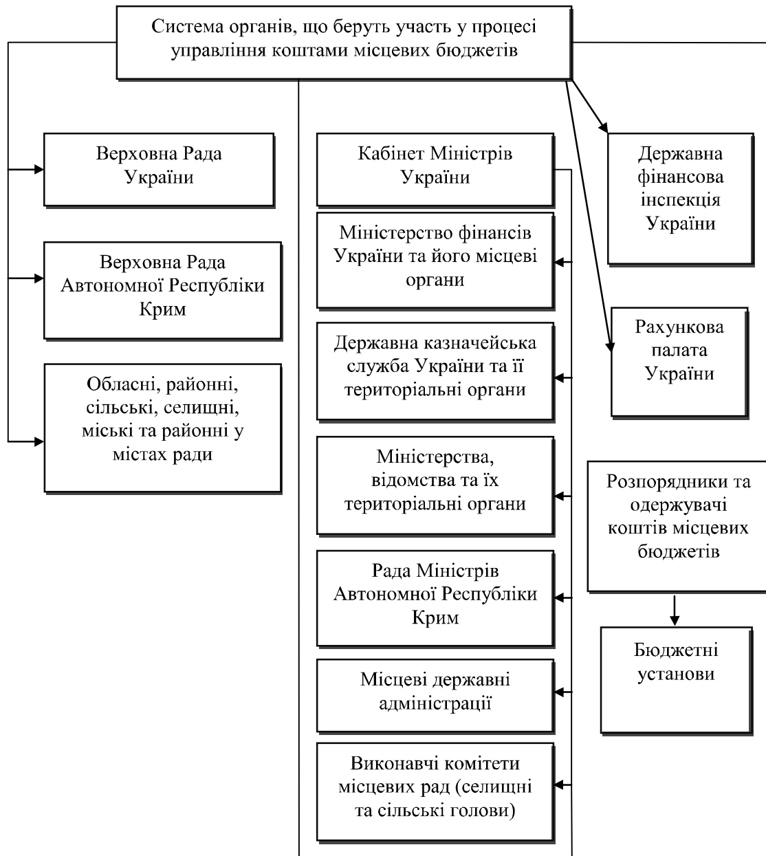
Рис. 2. Суб'єкти управління коштами місцевих бюджетів

розрахунків до проектів місцевих бюджетів на наступний бюджетний період. Після схвалення Кабінетом Міністрів України проекту Закону про Державний бюджет України Мінфін доводить зазначеним вище органам: розрахунки прогнозних обсягів міжбюджетних трансфертів; методику їх визначення та інші показники, необхідні для складання місцевих бюджетів; пропозиції щодо форми проекту рішення про місцевий бюджет (типова форма рішення).