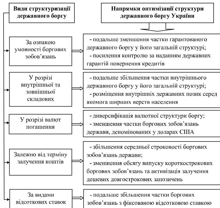
Рис. 4. Основні напрямки оптимізації структури державного боргу України на сучасному етапі *

Загалом оптимізація структури державного боргу України у заданих напрямках сприятиме посиленню значення державного боргу як ефективного інструмента стиму-