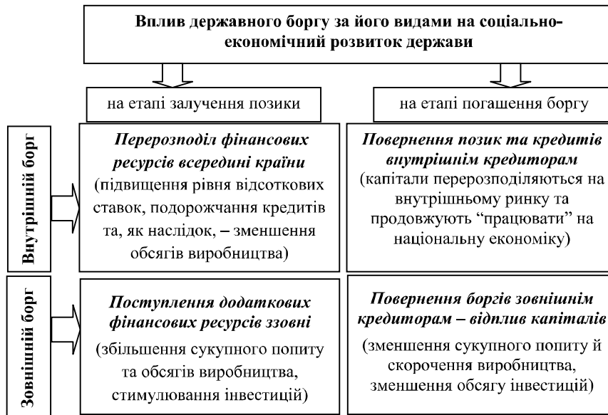
Рис. 1. Вплив внутрішнього та зовнішнього державного боргу на соціально-економічний розвиток держави на етапах залучення позик та погашення боргових зобов'язань*