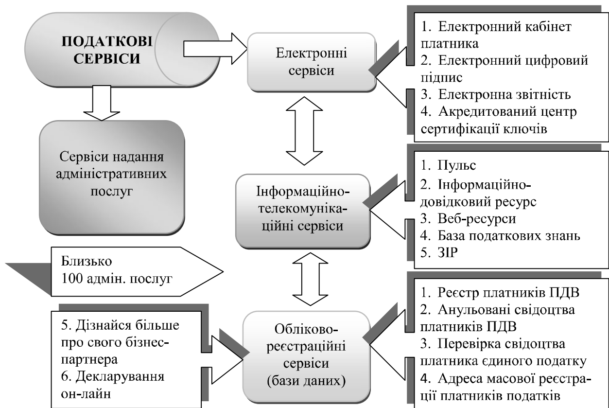
Рис. 1. Класифікація видів податкового сервісу

Як бачимо з рис. 1, поділ податкових сервісів за категоріями на електронні, інформаційно-телекомунікаційні, обліково-реєстраційні та сервіси надання адміністративних послуг, з одного боку, дозволяє чітко їх класифікувати за напрямками використання та безпосереднім призначенням, а з іншого – є досить умовний, оскільки між усіма видами податкових сервісів існує тісний взаємозв'язок, або переплетення функцій шляхом їх взаємодоповнення. Наприклад, інформаційно-телекому-