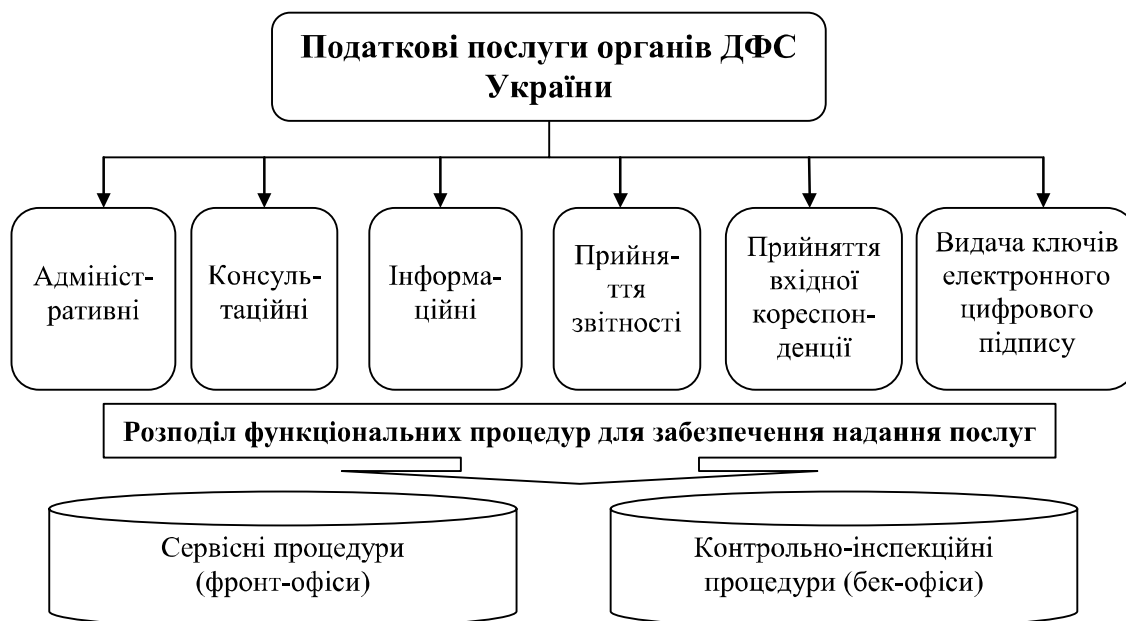
Рис. 2. Перелік послуг, які надають платникам органи ДФС України, та процедури їх забезпечення*

Крім цього, електронні сервіси тісно взаємопов'язані з системою надання ад-