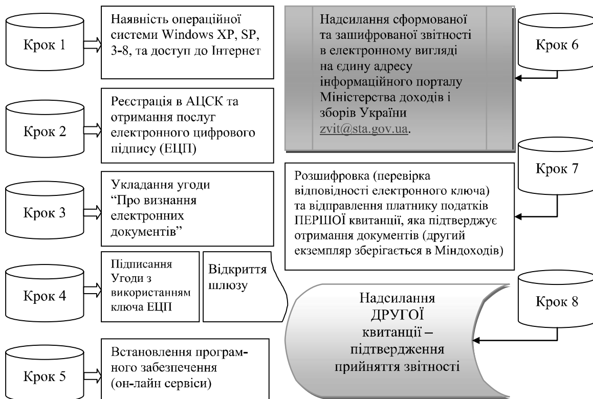
Рис. 4. Технологія формування та подання податкової звітності в електронному вигляді [4].

Для її реалізації в податкових органах відкрито Акредитований центр сертифікації ключів Інформаційно-довідкового департаменту (АЦСК ІДД) Міндоходів, який надає послуги електронного цифрового підпису органам державної влади, органам місцевого самоврядування, підприємствам, установам та організаціям всіх форм влас-