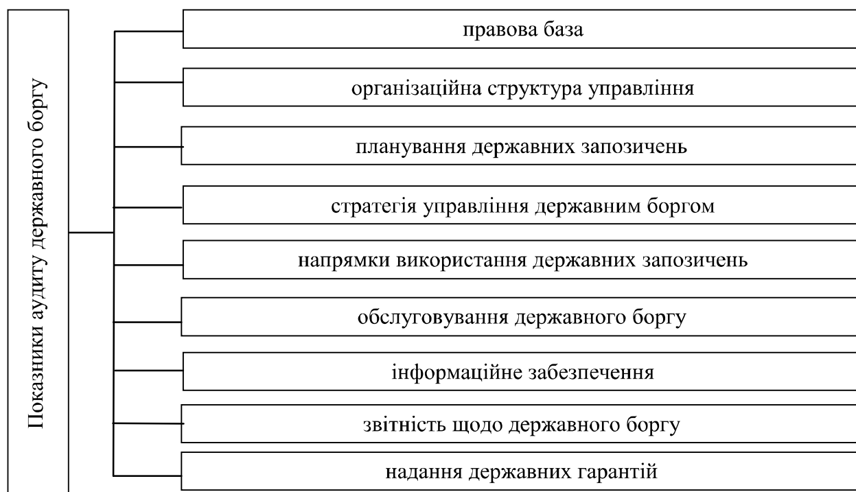
Рис. 1. Показники аудиту ефективності управління державним боргом*