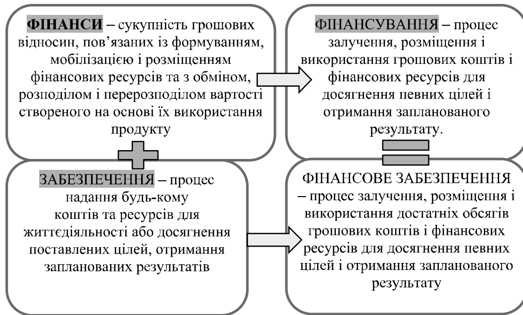
Рис. 1. Схема визначення сутності поняття “фінансове забезпечення”

чення в цілому можна розуміти як синонім, з тією відмінністю, що останнє потребує визначеної суми коштів.