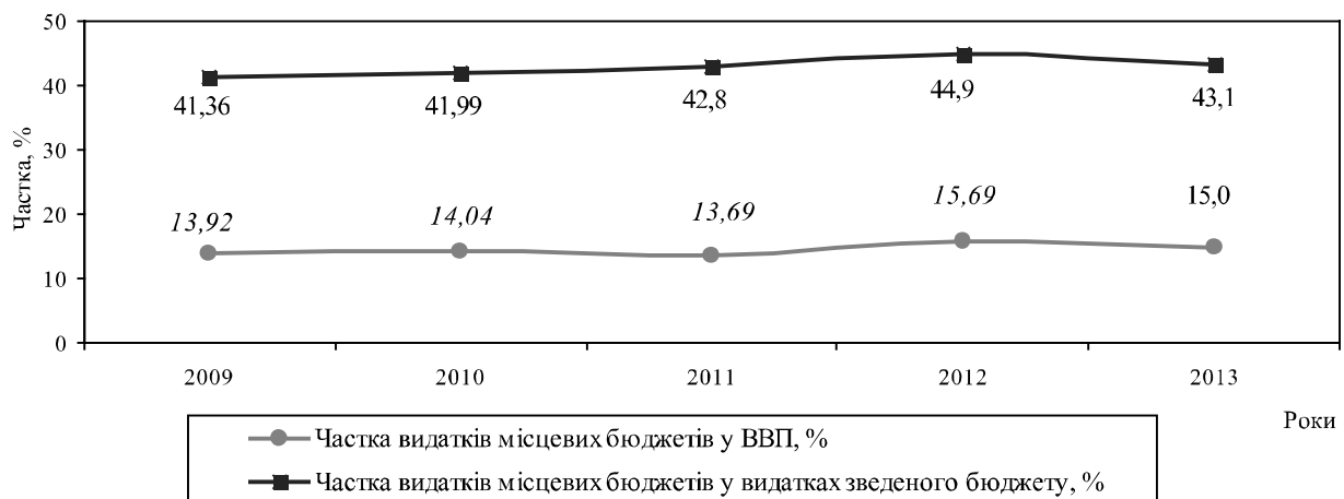
Рис. 1. Динаміка частки видатків місцевих бюджетів України (без урахування міжбюджетних трансфертів) у ВВП та видатках зведеного бюджету у 2009–2013 рр., %.*

– найбільшу питому вагу у видатках місцевих бюджетів України упродовж 2011–2013 рр. займали видатки соціального спрямування – 81,98% (середній показник за три роки), зокрема, на освіту – 32,85%, соціальний захист і соціальне забезпечення – 23,77%, охорону здоров'я – 21,57%, культуру, мистецтво, фізичну культуру, спорт, засоби масової інформації – 3,79%.