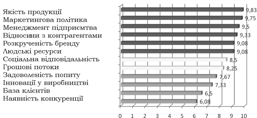
Рис. 2. Пріоритетність факторів формування гудвілу ПАТ «ТерА»