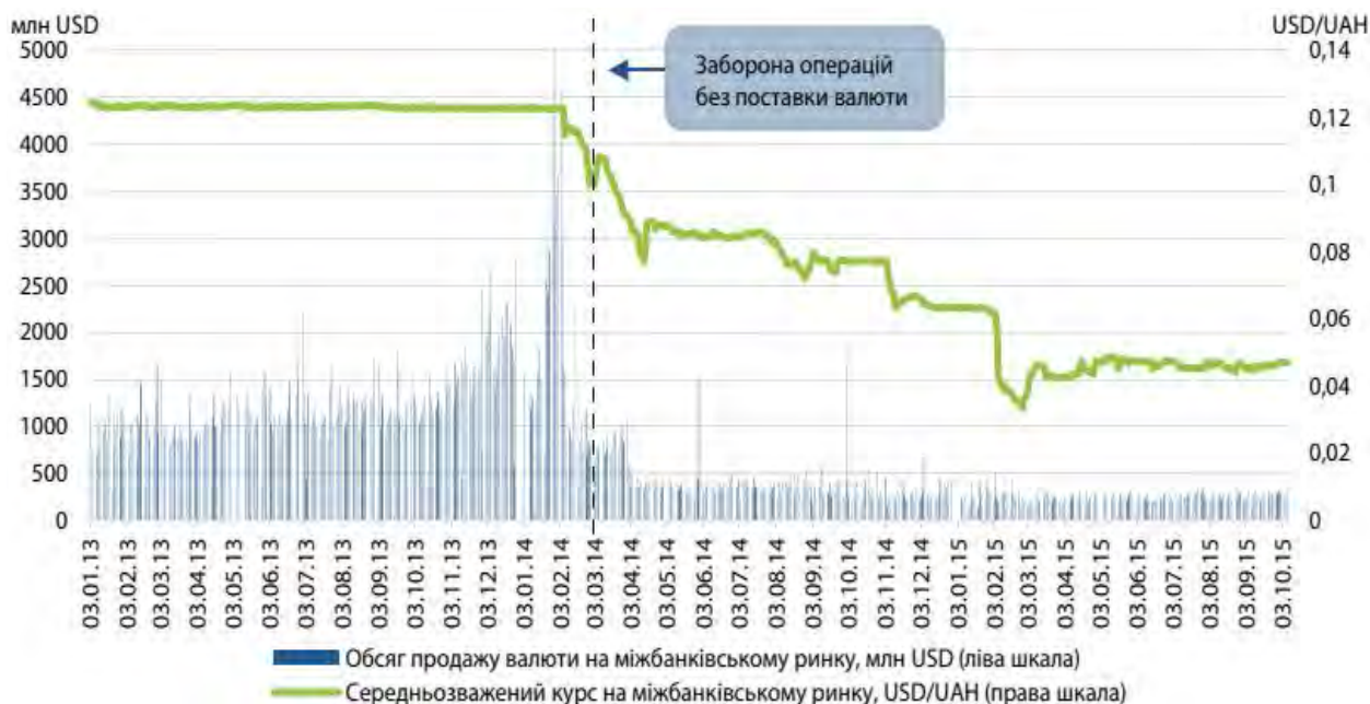
Рис. 2. Динаміка курсу та обсягів кредиту валюти на міжбанківському ринку України*