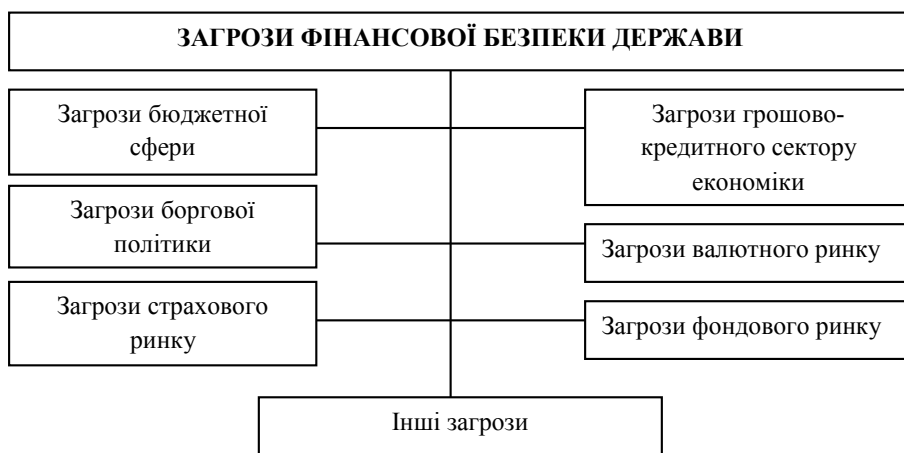
Рис. 1. Чинники фінансової безпеки держави*

Відповідно до Методики розрахунку рівня економічної безпеки України та враховуючи основні виокремлені загрози фінансової безпеки, вважаємо, що зовнішні загрози