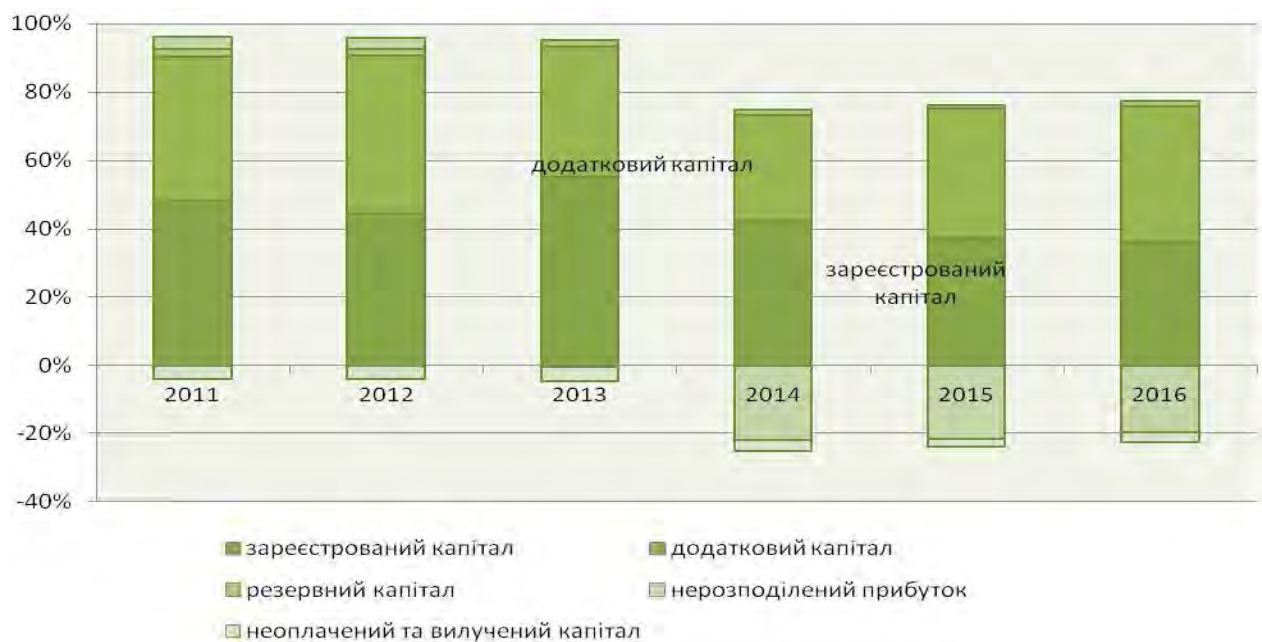
Рис. 4. Структура власного капіталу підприємств реального сектору економіки України у 2011–2016 рр., %*

Упродовж 2011–2016 рр. мала місце загальна декапіталізація реального сектору економіки на 18% (у цінах 2011 р., за показником балансової вартості власного капіталу), виникли структурні диспропорції у міжсекторальному розподілі капіталу. Дефіцит власного капіталу справляв подвійний негативний вплив на фінансову систему країни – як недостатність джерел фінансування продуктивного капіталу і як чинник системних ризиків. Номінальне зростання агрегованого власного капіталу підприємств реального сектору економіки упродовж