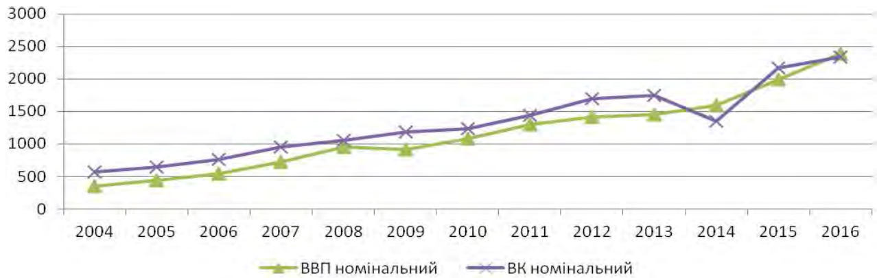
Рис. 2. Динаміка власного капіталу (ВК) реального сектору економіки та ВВП в Україні в 2004–2016 рр., млрд грн