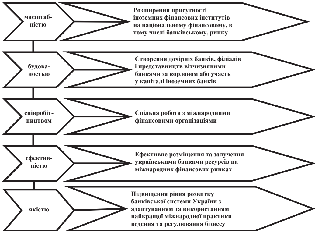
Рис. 1. Загальні ознаки формування фінансового простору з іншими країнами*