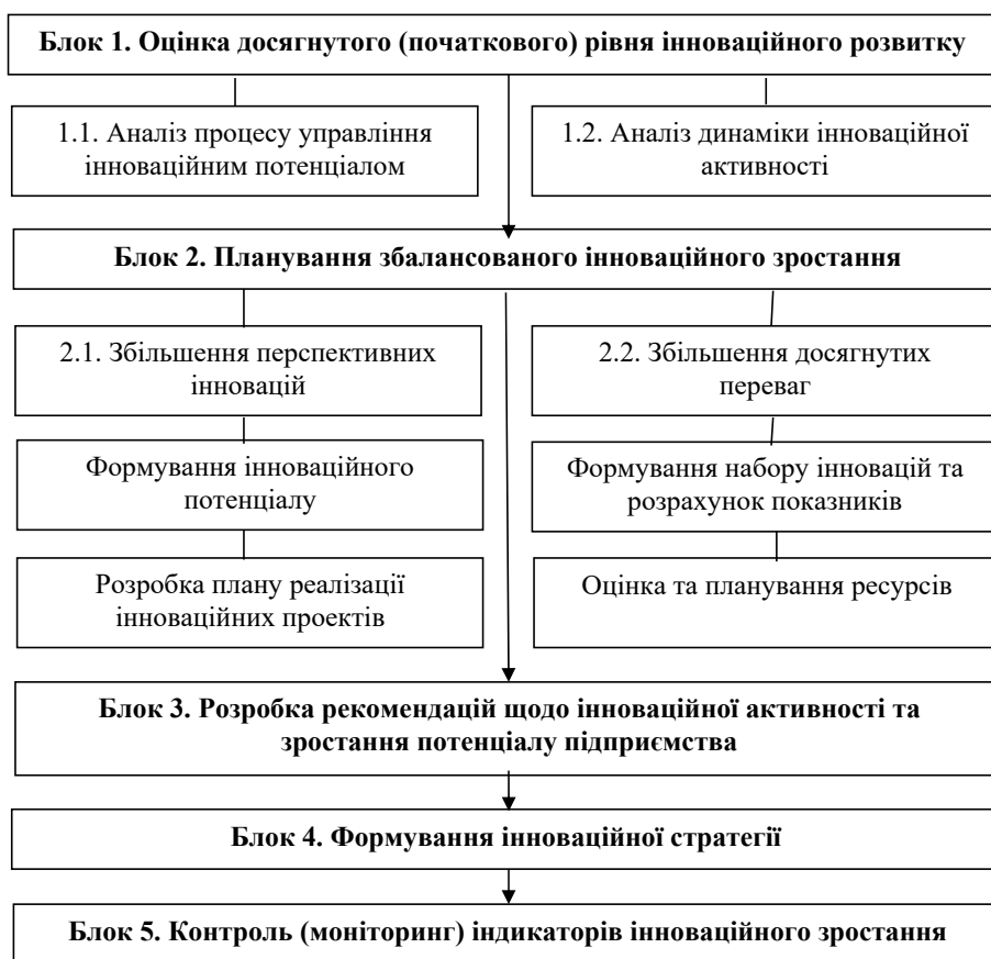
Рис. 2. Модель процесу розробки та реалізації стратегії інноваційного зростання підприємства *

Проведене дослідження механізму інноваційної діяльності дає змогу зробити висновок про те, що формування і розвиток інноваційної стратегії управління суб'єктом господарювання є інтегрованим процесом, що об'єднує прогнозування, планування та облік ресурсної бази підприємства на довгострокову, середньострокову і короткострокову перспективи в нових умовах модернізації економіки держави.