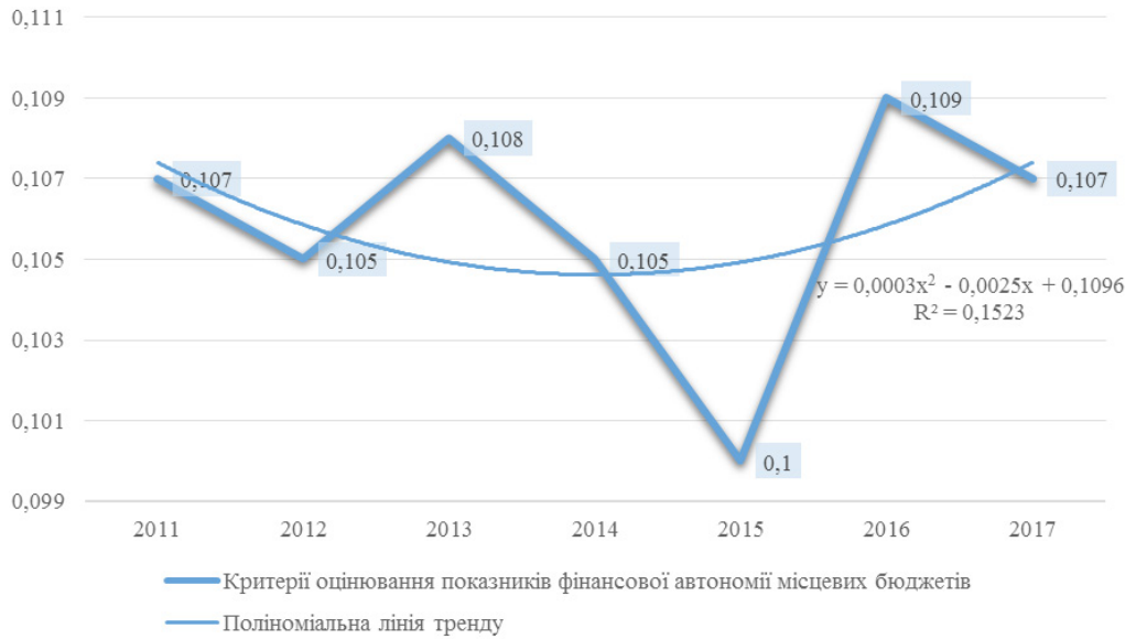
Рис. 2. Поліноміальний тренд субіндексів оцінювання фінансової автономії місцевих бюджетів