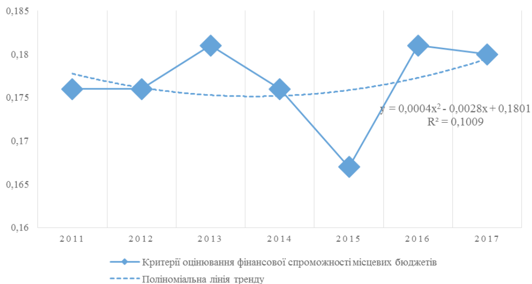
Рис. 1. Поліноміальний тренд субіндексів оцінювання фінансової спроможності місцевих бюджетів

Аналіз показників субіндексів оцінювання боргового навантаження місцевих бюджетів (рис. 4) свідчить про зростання боргового навантаження на місцеві бюджети у 2012 р., у 2013 р. це навантаження