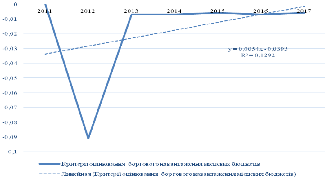
Рис. 4. Лінійний тренд субіндексів критеріїв оцінювання боргового навантаження місцевих бюджетів

Апробація запропонованої методики підтвердила можливість її використання для аналізу фінансової стійкості місцевих бюджетів України.