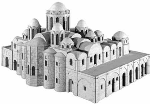
Рис. 1. Софійський собор. Східний та північний фасади. Макет-реконструкція XI ст., М.Й. Кресальний, В.П. Волков, Ю.С. Асеев

1150, 1151) і щоразу виконував у соборі обряд посідання великокняжого престолу. У 1169 р. Софію було пограбовано Мстиславом, сином ростово-суздальського князя Андрія Боголюбського, 1204 р. – Рюриком Ростиславичем. 1180 р. під час пожежі, що спалахнула у Верхньому Києві, Св. Софія була пошкоджена вогнем.