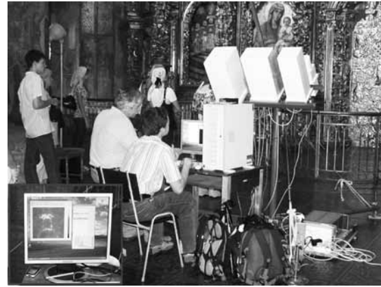
Рис. 5. Випробування приладу мікрохвильового вимірювання вібрацій та деформацій конструкцій.