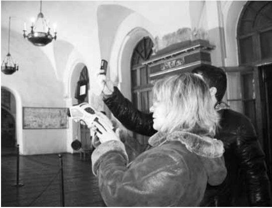
Рис. 4. Термографічні дослідження.