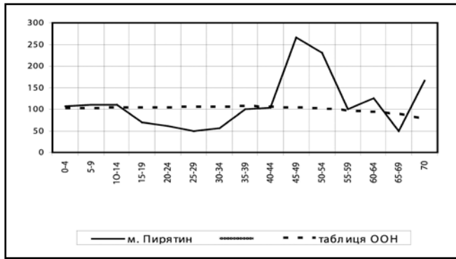
Мал. 2. Вікове співвідношення за статтю

таблиці ООН. Це можна пояснити тим, що «таблиця ООН» створена для закритого населення, а населення ранньомодерного міста було відкритим – воно зазнавало впливів міграцій, участі чоловіків у військових діях, різної смертності тощо. Поєднання різних чинників сформувало і відповідне співвідношення статей сотенного містечка.