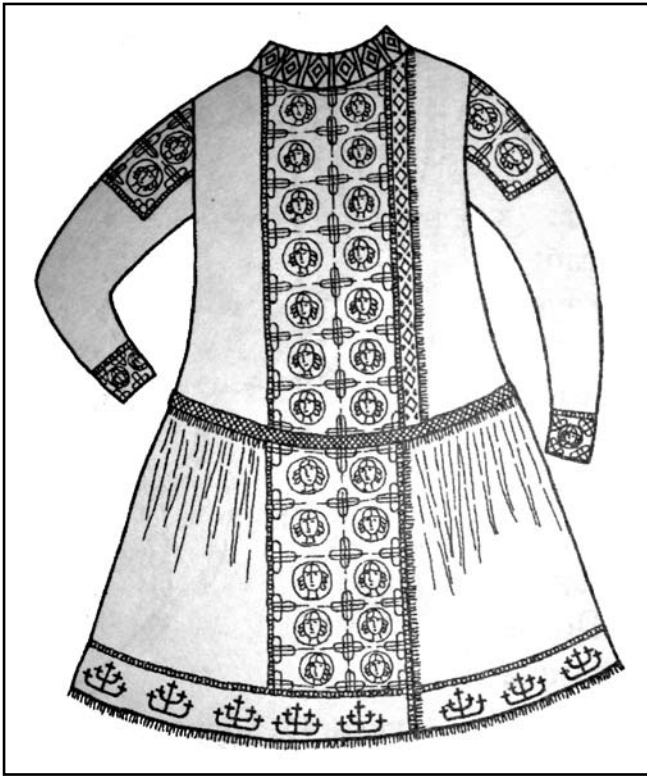
Гл. № 4. Реконструкція половецького каптана з Чунгульського кургану

орда, вдершись на Русь, «...взяша 6 городовъ Берендиць» [4]. Тобто кочові народи поступово вкорінювались, їх заняттями серед заможних представників стає торгівля і посередництво між Хозарією, Руссю, Візантією і грецькими колоніями, у тому числі работоргівля. Менш заможні осідають на землі [4].