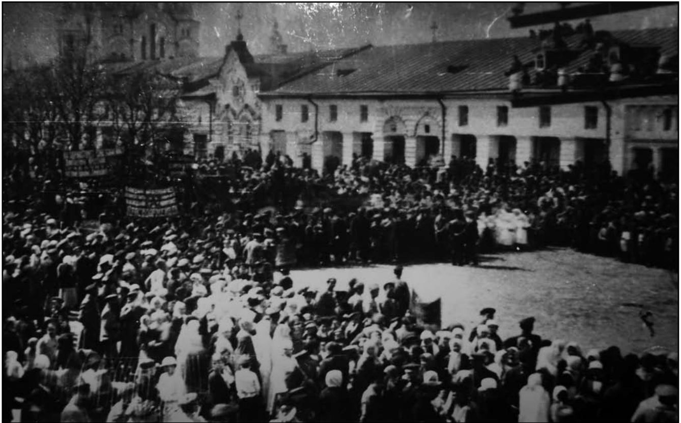
Мітинг на центральній площі м. Глухова у 1920-ті роки. ГKM – н/д–5091

на выезде из города необходим был пропуск за подписью коменданта. Цыганок свирепствовал и жители предпочитали сидеть дома, никуда не выходя. Ложились спать очень рано, т. к. красногвардейские патрули, разгуливавшие по улицам, заходили в тот дом, где виден был свет и располагались ужинать. Настроение у всех было подавленное – неизвестно, долго-ли продолжалось бы такое положение; атмосфера была очень сгущенная.