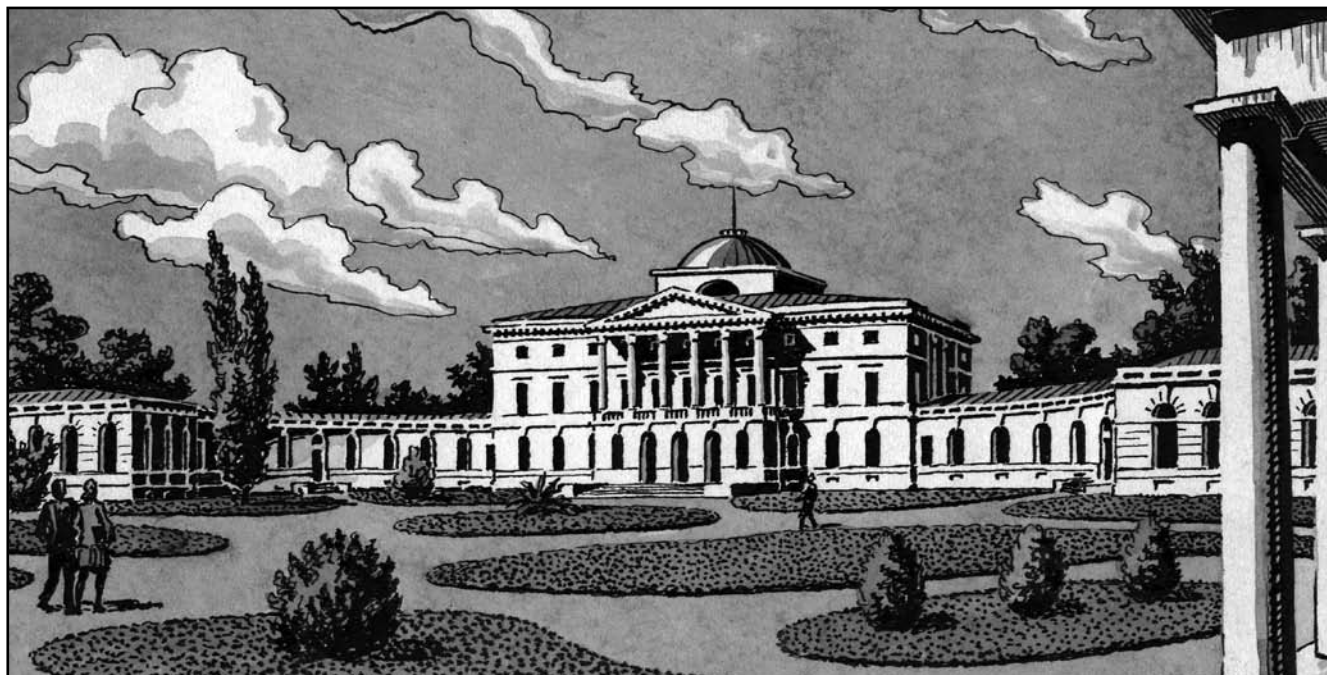
Вид на парадный курдонер дворца П. Завадовского в с. Ляличи