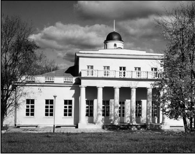
Дом М. Тенишевой в Хотылеве

регулярной планировки с ландшафтной, при территориальном господстве последней.