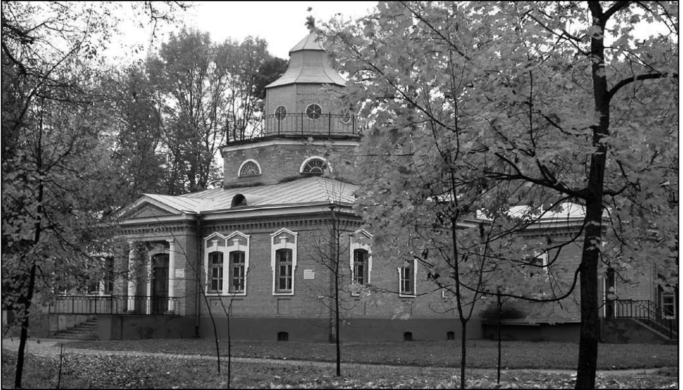
Красный Рог. Охотничий замок А.К. Толстого

объекты, ценные в дендрологическом отношении.