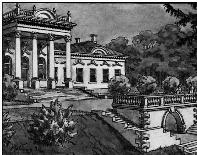
Усадебный дом Ф.И. Тютчева в Овстуге

К 200-летию со дня рождения поэта усадьба была возрождена. Воссоздан дом поэта, флигель, другие объекты музея, появилась и новая планировка парка... Безжалостное время стерло следы старой планировки. Да и была ли она? «Мне очень ярко вспомнился и как бы открылся зачарованный мир детства, так давно