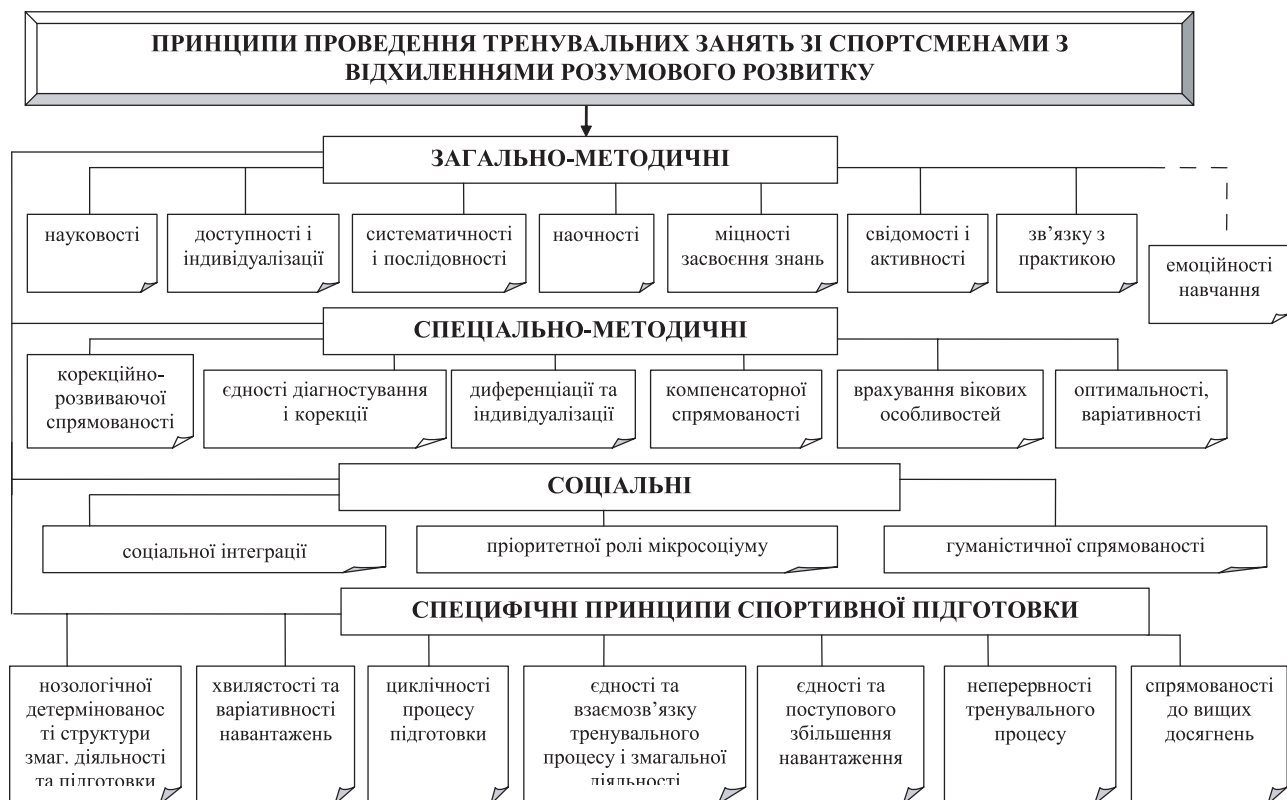
Рис. 2. Принципи проведення тренувальних занять зі спортсменами з відхиленнями розумового розвитку

Не дивлячись на те, що науковцями з адаптивної фізичної культури, корекційної педагогіки було виявлено корисний вплив систематичних тренувальних занять на організм осіб з відхиленнями розумового розвитку, на сьогоднішній день науково не обґрунтовані умови реалізації дидактичних принципів під час проведення тренувальних занять зі спортсменами в залежності від ступенів розумової відсталості.