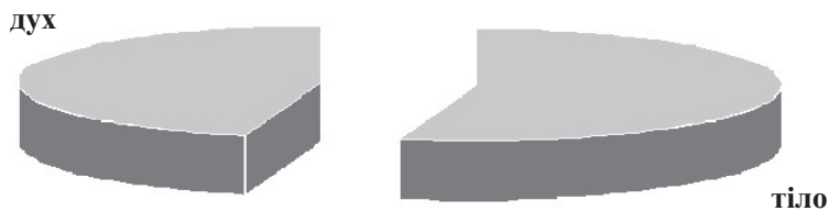
Рис. 3. Співвідношення посилянь у «Поученні»

Князь велику увагу приділяв виформовуванню сильного духу, налаштуванню його до високих прагнень добра та суспільної користі. У порівняно невеликому за обсягом творі є 44 посилянь на релігійні джерела. Нами визначено, що найбільше посилянь на Псалми зі Святого Письма (43%). Псалом – це грецькою означає піснопіння, а збірка псалмів – Псалтир, з єврейської - «книга хвали». З рис. 1 видно, що в тексті часто зустрічаються молитви (25%), майже 16 % припадає посилянь на тропарі (молитовний вірш для співу на честь якого-небудь свята або свята у православному богослужінні), по 4,5% - на кондаки та на Євангеліє від Матвія; Послання ап. Іоана, Ісайя, Послання Павла по 2,27%, що вчить високо цінувати християнські чесноти – страх Божий мати у серці своїм.