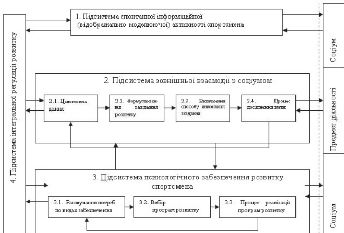
Рис. 1. Структурна модель розвитку СТД спортсмена

витку соціотехнічних систем діяльності спортсменів-важкоатлетів під час фізичної реабілітації.