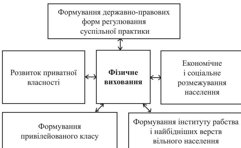
Рис. 3. Передумови формування системи фізичного виховання у рабовласницькому суспільстві (IV тис. до н.е. – сер. V ст.)

У цей час з'являються більш системні концепції виховання, які, крім загальнопедагогічних ідей, охоплювали і виховну проблематику раннього дитинства. Умови, мета, засоби виховання почали орієнтуватися на забезпечення диференційованого засвоєння культури. Освіта розвивалася відповідно до соціального та майнового становища. Фізична культура також набувала класового характеру. Панівний клас створив, у відповідності з рівнем матеріального життя суспільства і своєї ідеології, необхідні умови для виховання і військово-фізичної підготовки підростаючого покоління свого класу. Створювались спеціальні системи, в яких основна увага приділялась фізичному вихованню. Ці системи були спрямовані на те, щоб зміцнити рабовласницьку державу, дати військову і фізичну підготовку майбутнім воїнам-рабовласникам (рис. 3).