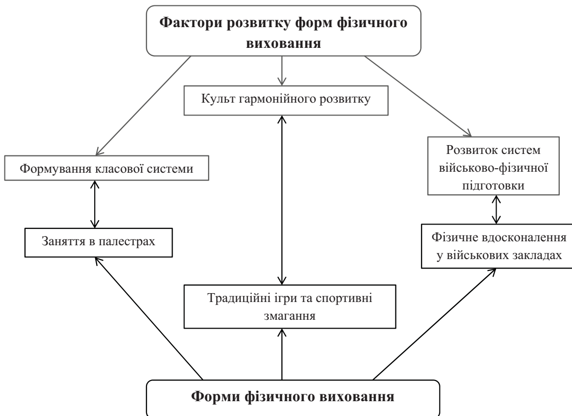
Рис. 2. Фактори, що сприяли виникненню організованих форм фізичного виховання у рабовласницькому суспільстві.

факторів на розвиток форм фізичного виховання. Крім того, широкого розвитку отримали різноманітні ігри і свята в честь богів, в яких брали участь велика кількість населення стародавніх полісів.