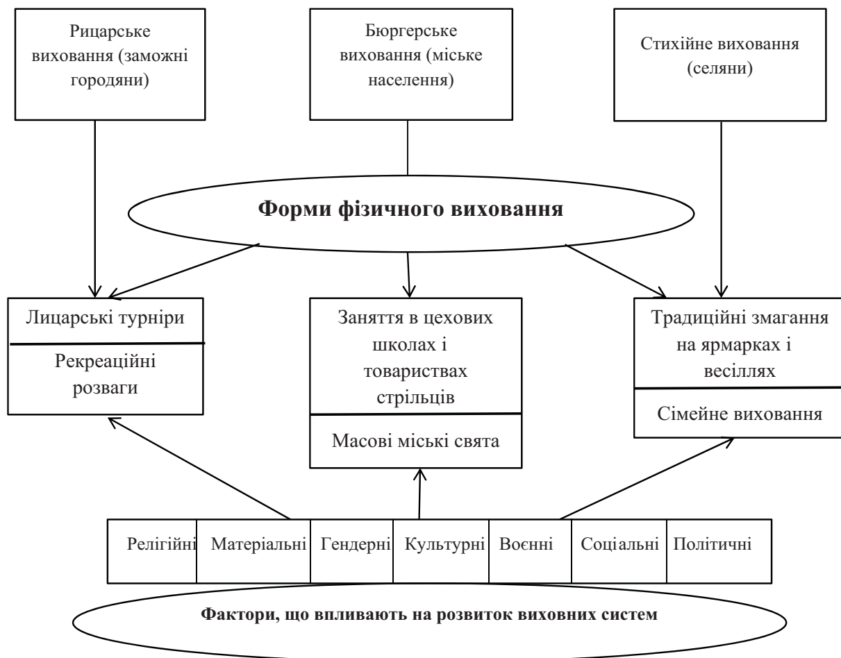
Рис. 3. Фактори формування передумов виникнення форм організації фізичного виховання у феодальному суспільстві

організовано навчали їздити верхи, плавати, стріляти з лука, битися, а також – розважальним іграм на майданчиках і грі з м'ячем для служби при дворі.