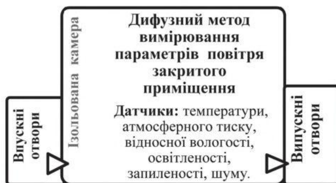
Рис. 4. Структурна блок-схема повітряно-кліматичної камери