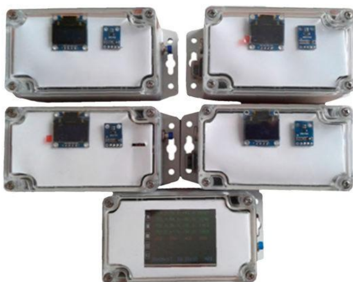
Рис. 1. Зовнішній вигляд АПСЕ-1.

На рис.1 зображено першу модифікацію системи, яка водночас вимірює чотири параметри повітряного середовища: температуру, відносну вологість, атмосферний тиск повітря та освітленість.