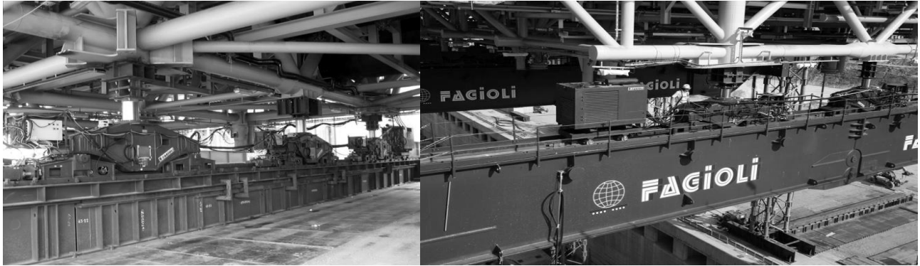
Рисунок 4. Фото-фіксація сучасних технологій з використанням телескопічних і тросових гідродомкратних систем різними іноземними фірмами (В центрі застосування тросових гідродомкратів для піднімання покриття на Олімпійському стадіоні у м. Києві).

Враховуючи складні будівельні прогнози на перспективи по використанню найсучасніших іноземних технологій на Україні, які можливо було б застосувати при будівництві нових будівель і споруд, реконструкції і монтажу технологічного обладнання, які мали би великорозмірні блоки, покриття чи частини споруди з повною заводською готовністю і масою до 5000 т., виникла наукова проблемна ситуація (задача) по створенню і розробці таких організаційно-технологічних рішень за рахунок потужних гідродомкратних систем вітчизняного виробництва. Створення і розробка гідродомкратних систем може стати одним із елементів наукового пошуку інженерів і наукових працівників, які працюють в цьому напрямку.