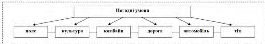
Рис. 2 – Вплив погодних умов на складові параметри збиральної кампанії

Актуальним є дослідження впливу параметру «Погодні умови» на складові параметри системи, зокрема збирально-транспортні процеси збирання врожаю пшениці (рис. 2).