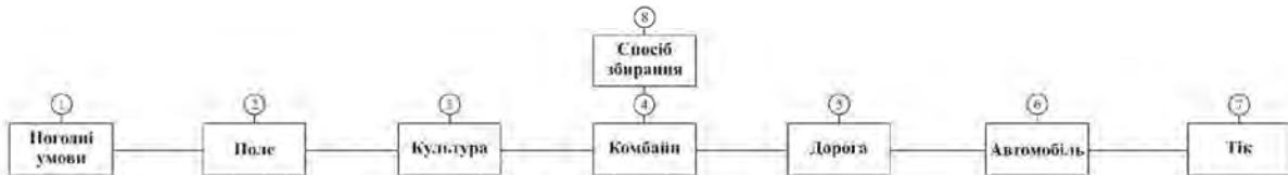
Рис. 1 – Структурна модель параметрів системи збирання врожаю

На першому етапі необхідно зробити аналіз системи, що включає її декомпозицію на складові параметри, встановити їх ієрархії та сили впливу. Параметри, що впливають на результат збирання врожаю представлено на рис. 1.