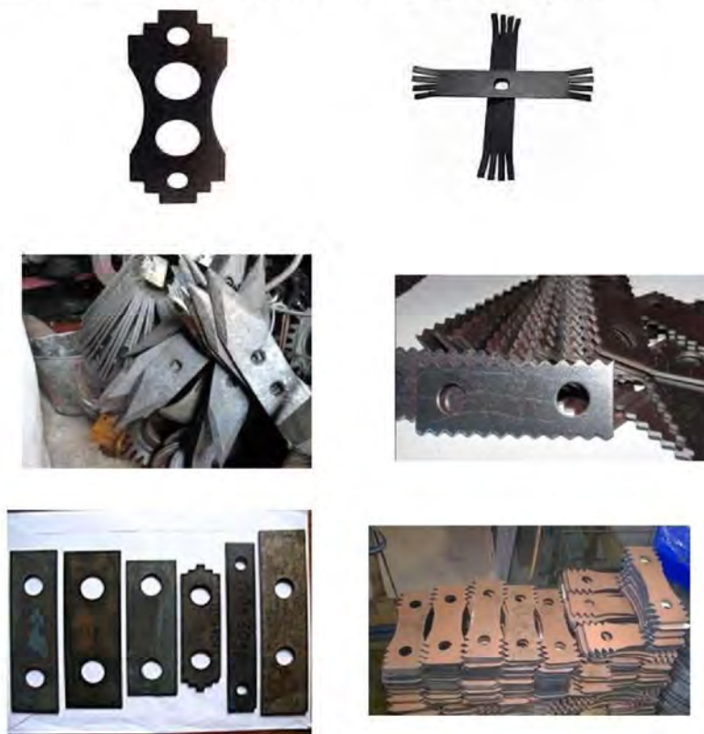
Рис 3 – Сучасні види молотків зернових дробарок

Існує велика кількість та багато різновидів молотків (рис. 3), що відповідають сучасним вимогам та відрізняються один від одного але однією з актуальних проблем є знос при експлуатації що зменшує ефективність процесу подрібнення.