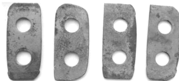
Рис. 2 – Спрацьовані молотки кормодробарок

Продуктивність сучасних дробарок коливається від 50 кг/год. до 20 т/год. і більше [6]. Проте, ці молоткові дробарки не позбавлені і певних недоліків, зокрема: таких як високі питомі витрати енергії на одиницю отриманого продукту; нерівномірність гранулометричного складу подрібненого корму; швидке затуплення робочих органів (ножів).