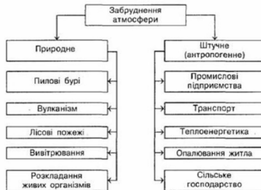
Рис. 3 – Схема забруднення атмосфери [13]

Раціональна маршрутизація, ефективно обрані транспортні засоби для транспортування вантажів, узгодження роботи навантажувально-розвантажувальних механізмів та автомобілів в розподільчих центрах, терміналах значно впливають на економію такого ресурсу, як час, та скорочують витрати на доставку та зберігання вантажів.