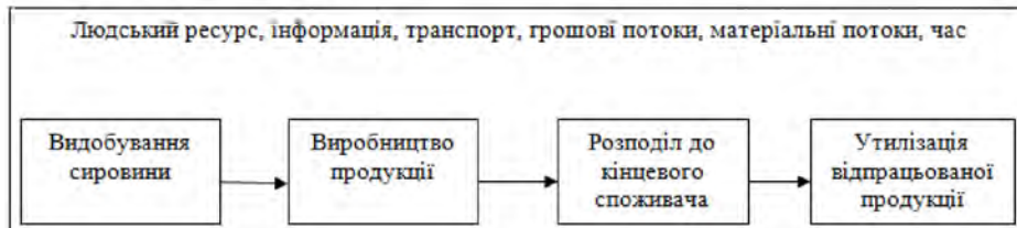
Рис. 1 – Лінійне представлення ресурсоспоживання

В даний час частіше використовується лінійне ресурсоспоживання. Тобто технології відновлення ресурсів розроблені та використовуються не в повній мірі.