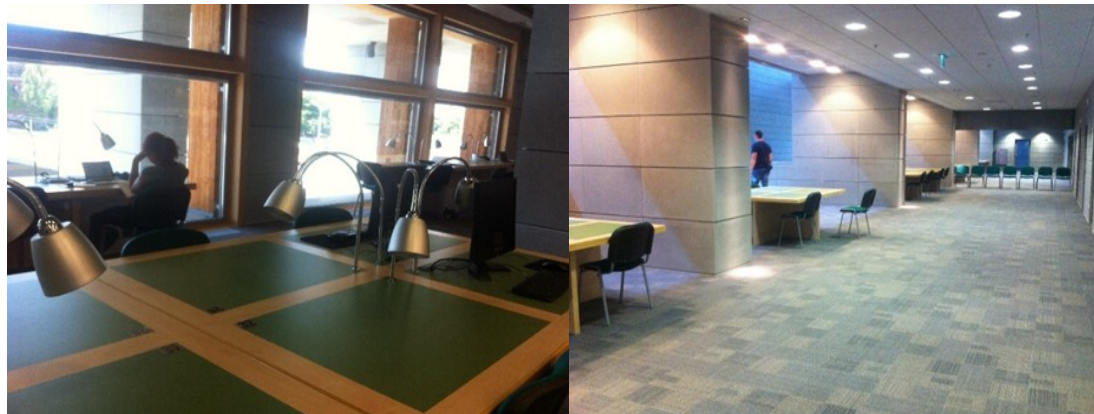
Зона для коворкінгу, Вроцлавський університет, м. Вроцлав, Польща