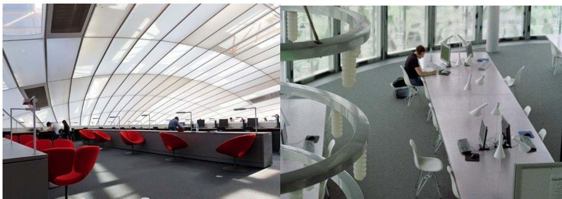
Відкриті робочі місця для індивідуальної роботи, оснащені комп'ютерами. Філологічна бібліотека Вільного університету, м. Берлін, Німеччина