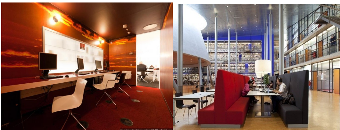
Закрита зона для індивідуальної роботи, Технічний університет, м. Дельфи, Нідерланди