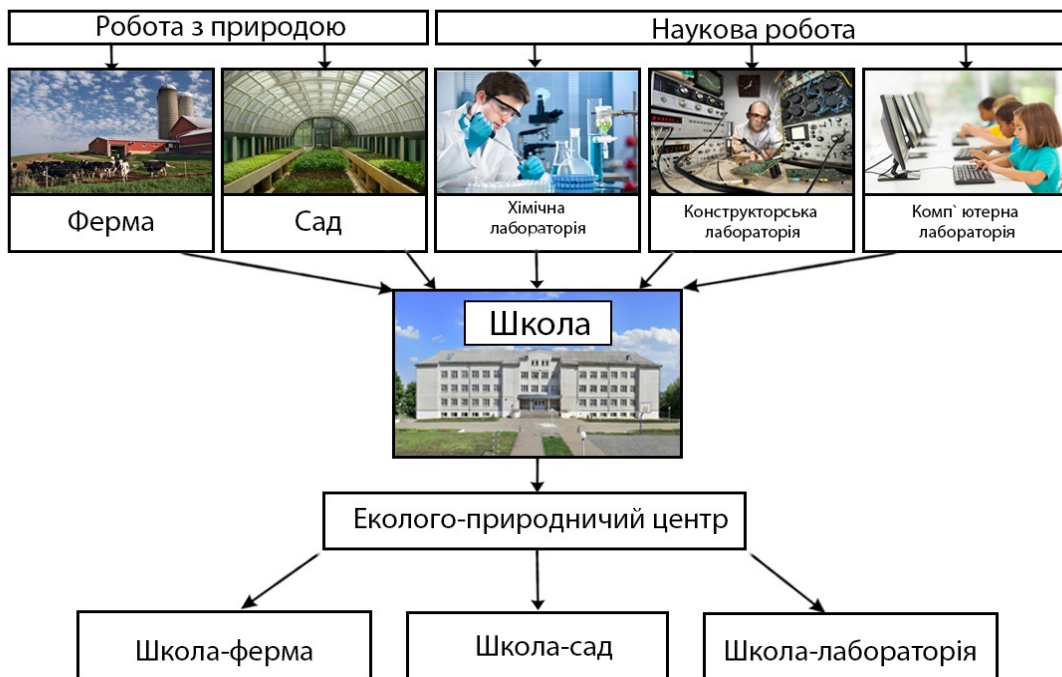
Рис. 2. Концептуальна схема організації простору еколого-натуралістичного центру

Зонування інтер'єру еколого-натуралістичного центру з урахуванням наведеної схеми (рис. 3) дозволить створити комфортне, функціонально обґрунтоване середовище для навчання та дозвілля, дозволить дитині відчувати психологічну захищеність, допоможе розвитку особистості, здібностей, оволодіння різними видами діяльності.