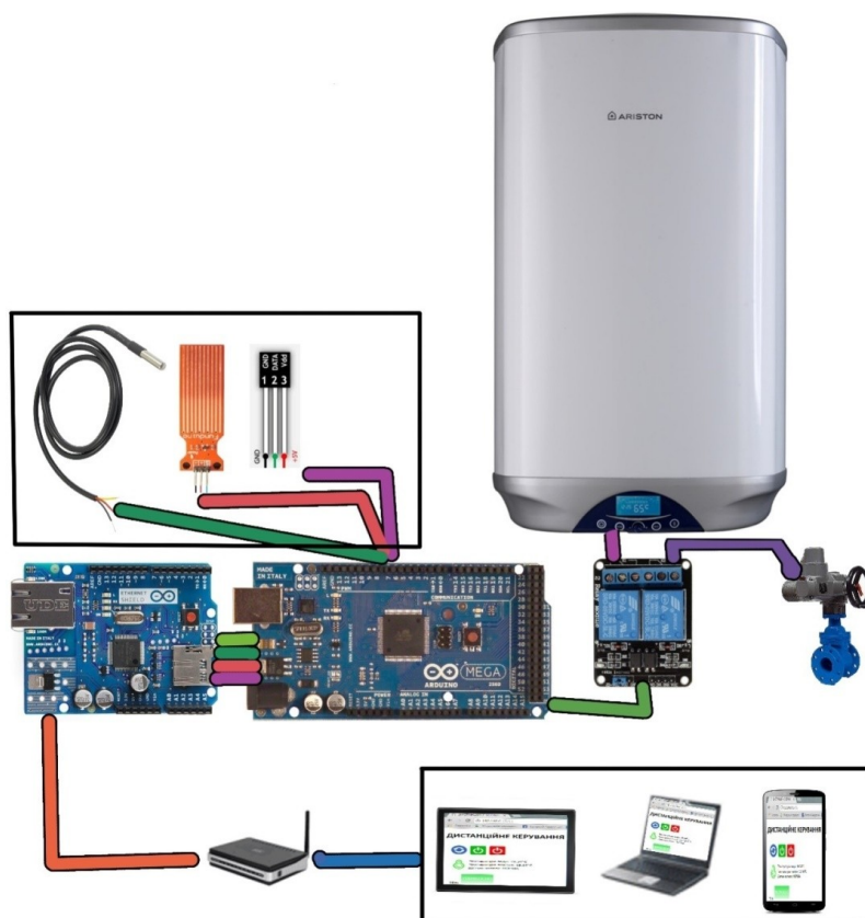
Рис. 2. Принципова схема дистанційного керування бойлером

Плата з двома реле керується контролером, і, в залежності від ситуації, може вмикати чи вимикати прилад, перекривати кульковий електричний кран.