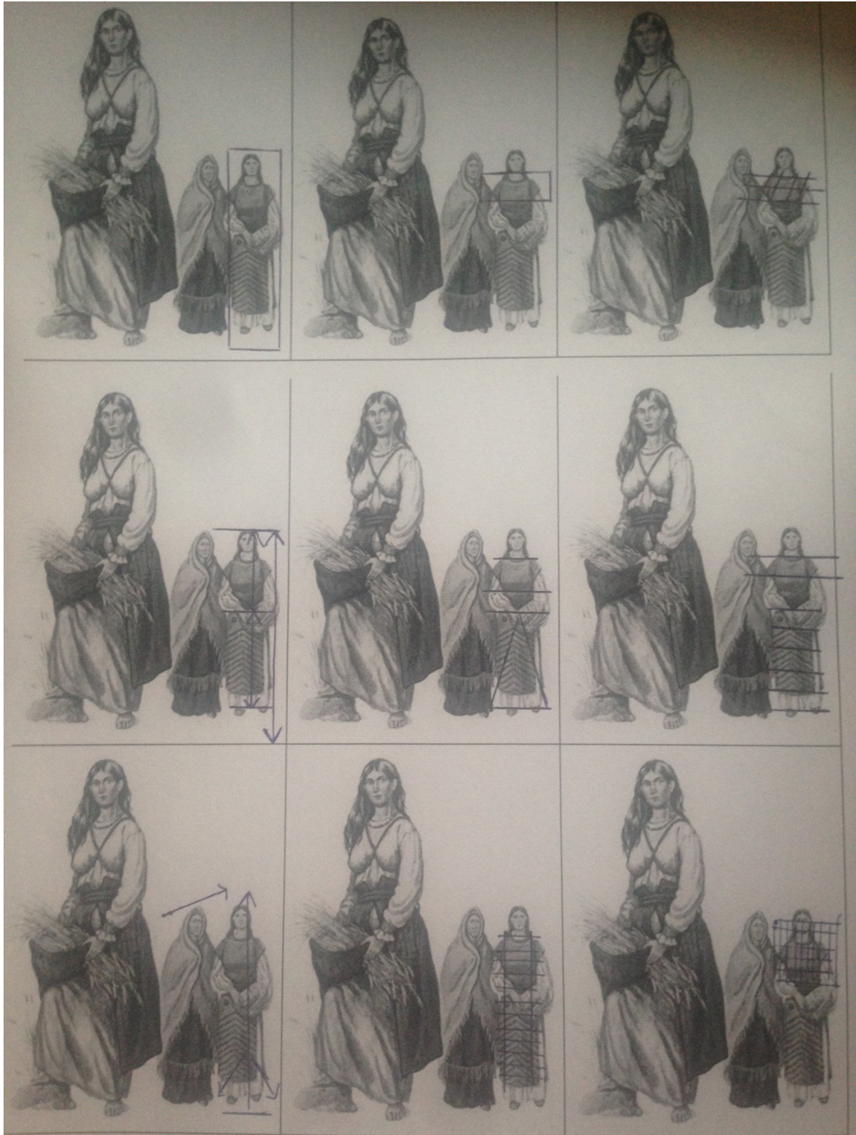
Рис. 6. Системно-структурний аналіз форм костюма Трипільської культури

втрачає його з роками. Виховуючи національну самосвідомість та гордість за високу культуру свого народу (рис. 7).