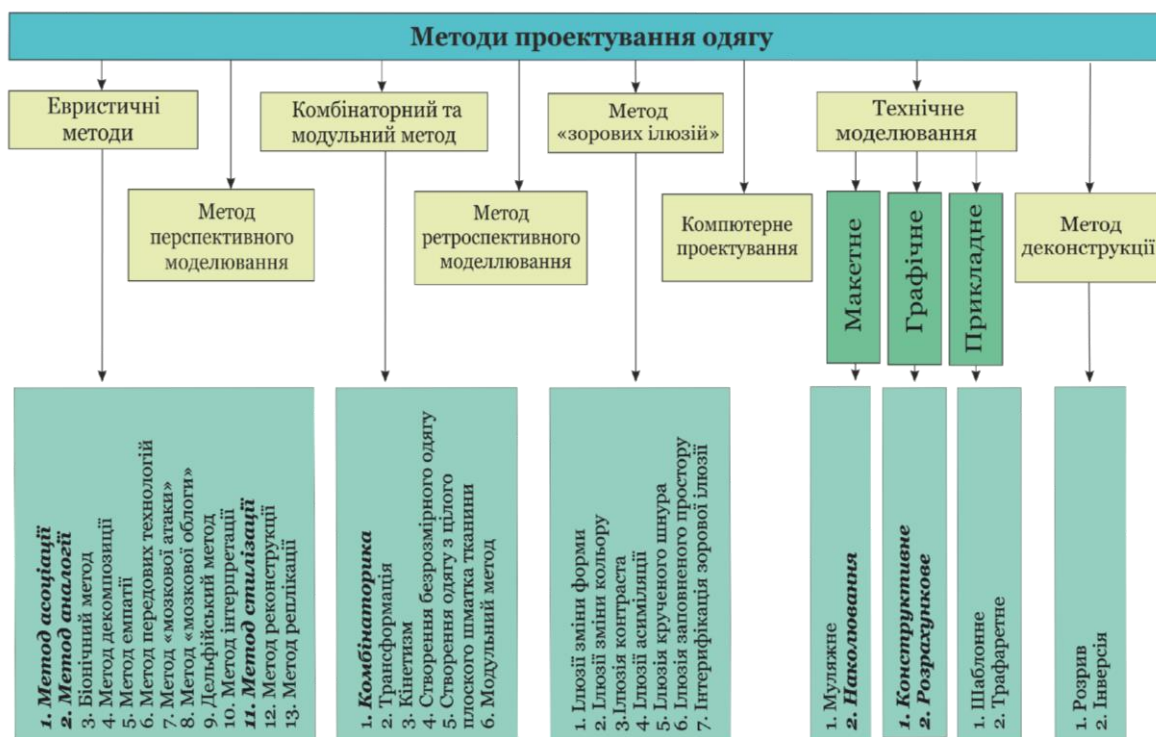
Рис. 2. Методи проектування одягу

Виходячи з аналізу методів констатуємо, що доцільним, при проектуванні сучасного костюму з етноелементами, використати комбінацію евристичних та сучасних методів проектування. Також важливим є застосування комбінаторних методів – методу комбінаторики та макетного методу – наколювання, принцип якого можна використати вже на початковому етапі проектування одягу в матеріалі. Використання конструктивного моделювання дозволить спроектувати нове конструктивне вирішення виробу, та вдосконалити функціональні його характеристики.