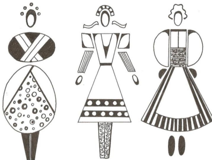
Рис. 3. Асоціації на джерело творчості

Асоціації, які виникли при формуванні ідеї представлені на рисунку 3.