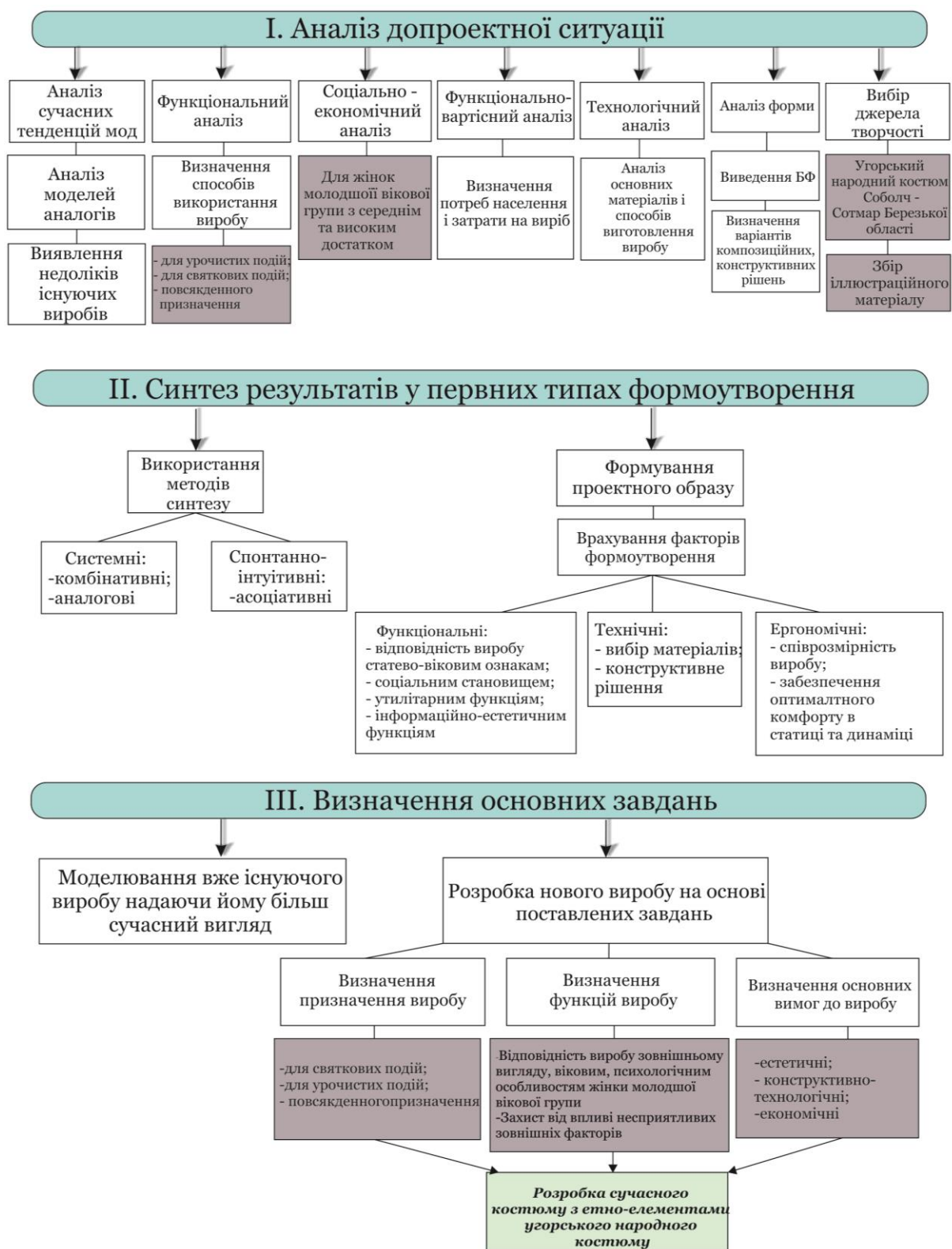
Рис. 1. Етапи проектування одягу на основі народного костюму (початок)