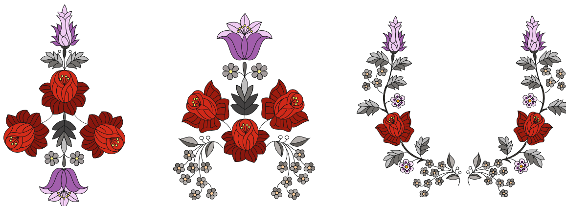
Рис. 7. Варіанти композиційних рішень вишивки методом комбінаторики

Для втілення ескізного задуму в готовий виріб, необхідним є застосування методу технічного моделювання. Цей метод дає можливість правильно «прочитати» ескіз, отримати деталі крою для наступного формування об'ємної форми одягу.