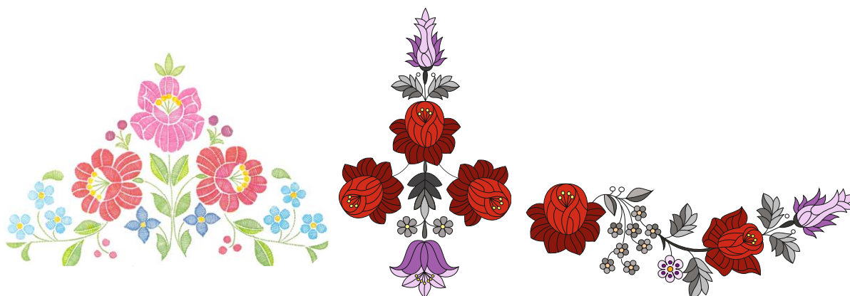
Рис. 6. Варіанти стилізованих рядів композиційних вирішень угорської вишивки Соболч-Сотмар Березької області

Застосування комбінаторного методу або методу комбінацій (рис. 7) в даній роботі, полягає в пошуку нових, різноманітних комбінацій композиційних вирішень вишивки на основі стилізованих структурних компонентів визначених форм та елементів у певному порядку шляхом перестановок, вставок, поєднань, групувань, переворотів, комбінування, пропорційних членувань всередині базової форми.