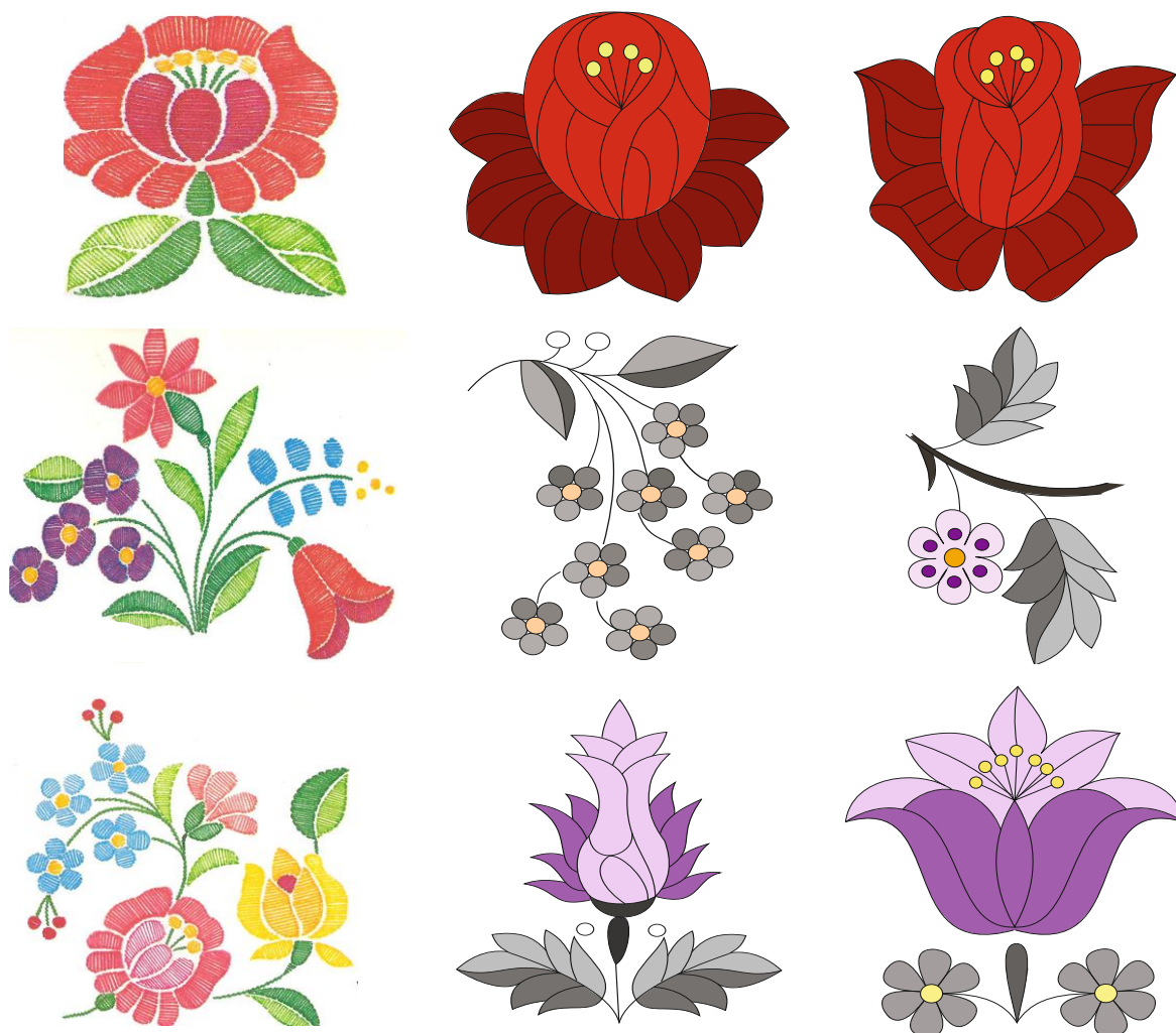
Рис. 5. Варіанти стилізованих рядів структурних компонентів угорської вишивки Собољч-Сотмар Березької області