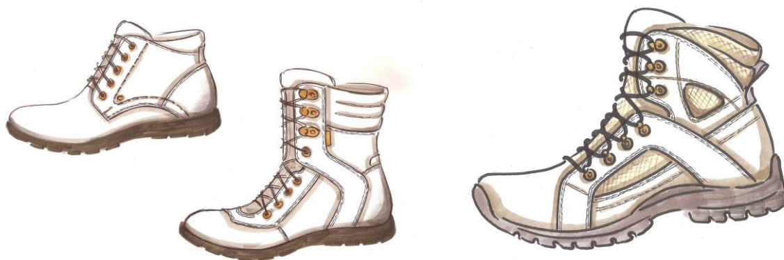
Рис.1. Розроблені черевики чоловічі та черевики з завищеними берцями

температурах від +20^{\circ}\text{C} до -20^{\circ}\text{C} . Для матеріалів верху використовували натуральну гідрофобну шкіру з водостійкістю, не менше 180 хвилин та синтетичну тканину Cordura 1000D. Низ взуття виготовлявся з двошарового поліуретану, де нижній шар монолітний, зносостійкий, а проміжний вспінений. Взуття виготовлялось литтєвим методом кріплення.