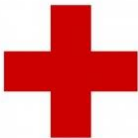
Рис. 2. Червоний хрест