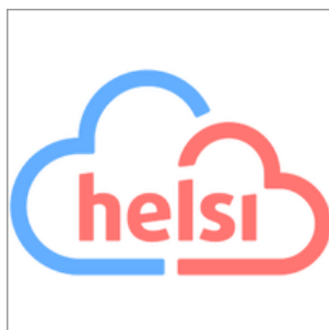
Рис. 7. HELSI