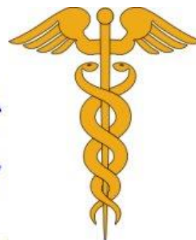
Рис. 4. Кадуцей

Що стосується попередніх уявлень людини про медицину, стає зрозуміло, що знак призначався до конкретного виду лікування шляхом асоціації із конкретним видом діяльності (рис. 5). Підсвідомо, людина сприймає інформацію, встановлюючи спільний зв'язок дії, із предметом діяльності.