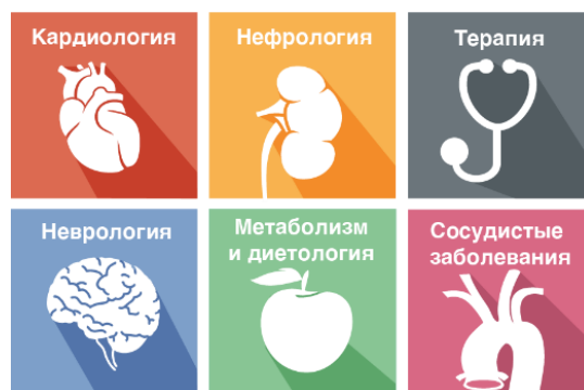
Рис. 5. Асоціативний ряд логотипів

Що стосується попередніх уявлень людини про медицину, стає зрозуміло, що знак призначався до конкретного виду лікування шляхом асоціації із конкретним видом діяльності (рис. 5). Підсвідомо, людина сприймає інформацію, встановлюючи спільний зв'язок дії, із предметом діяльності.