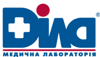
Рис. 10. DILA медична лабораторія