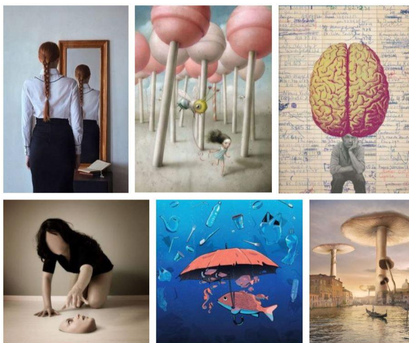
Рис. 2. Приклади використання у сучасній концептуальній ілюстрації прийомів фото колажу, плакату та мультиплікації – можуть розглядатись як самостійна форма станкової графіки

Постмодернізм як концептуалізм в образотворчому мистецтві явив собою сукупність тенденцій у художній культурі II пол. XX ст., зв'язаних із радикальною переоцінкою цінностей авангарду. Нові прояви авангарду виражаються у більш самокритичному відношенні мистецтва до себе, війна з традицією змінюється співіснуванням з нею, характерною рисою стає стилістична різноманітність. Концептуалізм, відмовляючись від раціоналізму «інтернаціонального стилю», звернувся до наочних цитат з історії мистецтва, міксуючи або синтезуючи їх, запропонував власне, нерідко суб'єктивне, бачення навколишнього світу, сполучаючи усе це з новітніми досягненнями комп'ютерних технологій й проголосивши гасло «відкритого мистецтва», вільно взаємодіючого з усіма іншими видами, старими і новими стилями. Тому не дивно, що прийоми плакату, наочної реклами, мультиплікації тощо стали засобами самовираження представників концептуальної ілюстрації (рис. 2).