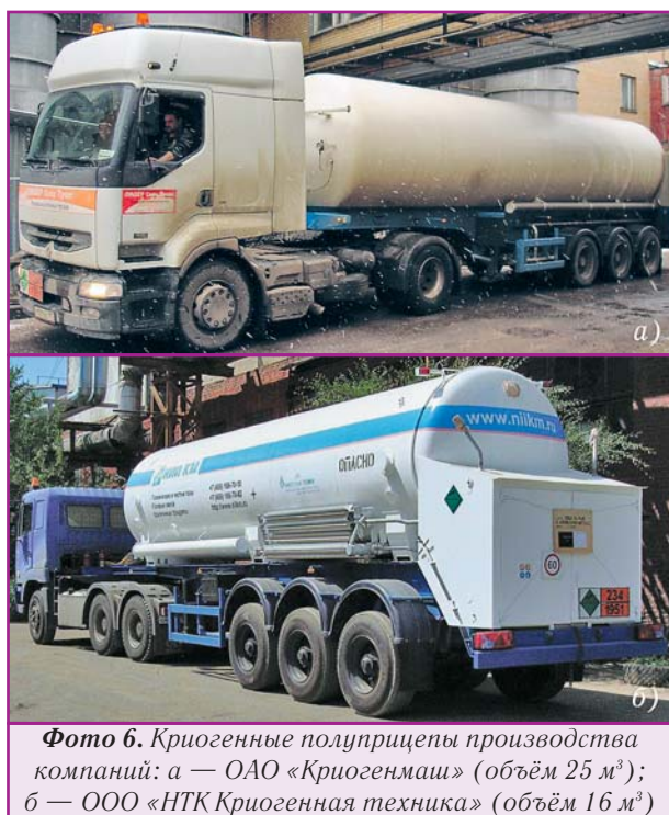
Фото 6. Криогенные полуприцепы производства компаний: а — ОАО «Криогенмаш» (объём 25 м 3 ); б — ООО «НТК Криогенная техника» (объём 16 м 3 )

До недавнего времени, а кое-где и сейчас, из-за отсутствия таких насосов прибегали к простому способу: давление в приёмном сосуде сбрасывалось до величины, необходимой для заправки «передавливанием». В этой связи заметим, что в последние 2-3 года ОАО «Криогенмаш» (фото 6,а) и ООО «НТК Криогенная техника» (фото 6,б) разработали и стали поставлять на рынок криогенные полуприцепы, оснащённые насосами модели GBS-155/4,5 производства компании «Cryostar» [2]. Ёмкости полуприцепов — 16 и 25 м 3 , а преодолеваемое давление — до 25 бар. Нужно отметить, что предельный груз автопоезда по дорогам России установлен нормативом на уровне 38 т. Как известно, плотность перевозимых жидких криопродуктов изменяется от 0,42 т/м 3 для СПГ и до 1,4 т/м 3 для аргона. Это обстоятельство необходимо учитывать при выборе автозаправщика. Поясним это примером: цистерна ёмкостью 16 м 3 сможет перевезти 22 т жидкого аргона и только 12,5 т жидкого азота; а цистерна 25 м 3 — 20 т жидкого азота и столько же жидкого аргона. Это количество жидкого аргона займёт всего 14,4 м 3 в цистерне объёмом 25 м 3 . Поэтому аргон выгоднее перевозить полуприцепом с ёмкостью 16 м 3 , в которой его с учётом норматива будет 22 т.