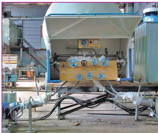
Фото 5. Заводские испытания установки для газификации азота

Некоторые компании приступили к изготовлению эффективного оборудования для использования в технологиях «жидкий криопродукт — газ». Так, в августе 2009 г. ООО «НТК Криогенная техника» выпустила криогенную компактную систему для газификации азота (фото 5). При этом в качестве питающей ёмкости был использован резервуар «ТРЖК-3». Система укомплектована двумя насосами модели A-MRP-40/50 [2], обеспечивающими давление до 420 бар и расход 24,6 л/мин.