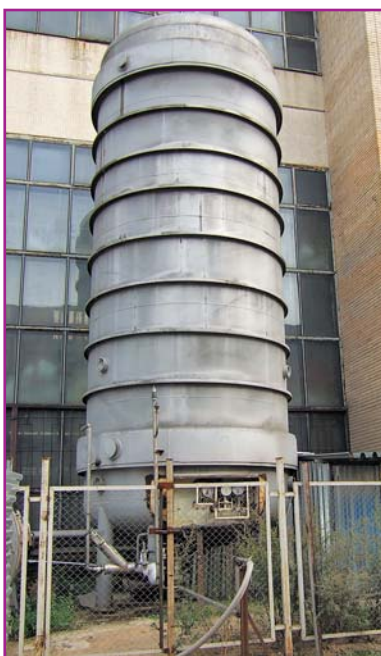
Фото 3. Резервуар РЦВ-40, оснащённый поршневым насосом высокого давления компании «Cryostar»

Приходится признать, что обсуждаемая технологическая схема нуждается в привлечении серьёзных инвестиций, так как она почти полностью комплектуется импортным оборудованием. Однако наш опыт показывает, что инвестиционная нагрузка может быть существенно снижена с одновременным достижением ощутимого эффекта. Нами был приобретён насос высокого давления компании «Cryostar» модели A-SDPD, который был соединён с широко используемым отечественным резервуаром РЦВ-63. У него имеется нижний слив. Для «холодного» возврата был использован трубопровод верхнего залива. Заправка резервуаров в начале осуществлялась из ёмкостей ЦТК-8. Схему использовали для газификации жидкого аргона. Затраты на модернизацию с учётом приобретения насоса составили около 1,5 млн. руб. Объём переработки составил около 1400 т/год жидкого аргона. В результате потери сырья сократились с 25 до 11 %, что позволило за период с декабря 2006 г. по август 2009 г. сэкономить 420 т аргона или 7,14 млн. руб. в денежном выражении, т.е. за это время затраты на переоборудование окупались почти 5 раз. Кроме того, были снижены транспортные расходы почти на 100 тыс. руб. Эффекты от снижения трудозатрат и экономии электроэнергии не оценивались. Аналогичная схема используется нами и для газификации азота (фото 3).