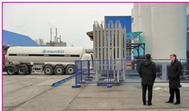
Фото 4. Общий вид наполнительного отделения ОАО «Завод Уралтехгаз» (г. Екатеринбург)

цового хозяйства в России может служить ОАО «Завод Уралтехгаз», использующий все компоненты современных технологий (фото 4): автозаправщики, оснащённые перекачивающими насосами; вертикальные криогенные резервуары; поршневые насосы высокого давления [3]. Венцом совершенства на этом предприятии является автоматизированная система управления наполнением баллонов не только чистыми газами, но и многокомпонентными их смесями.