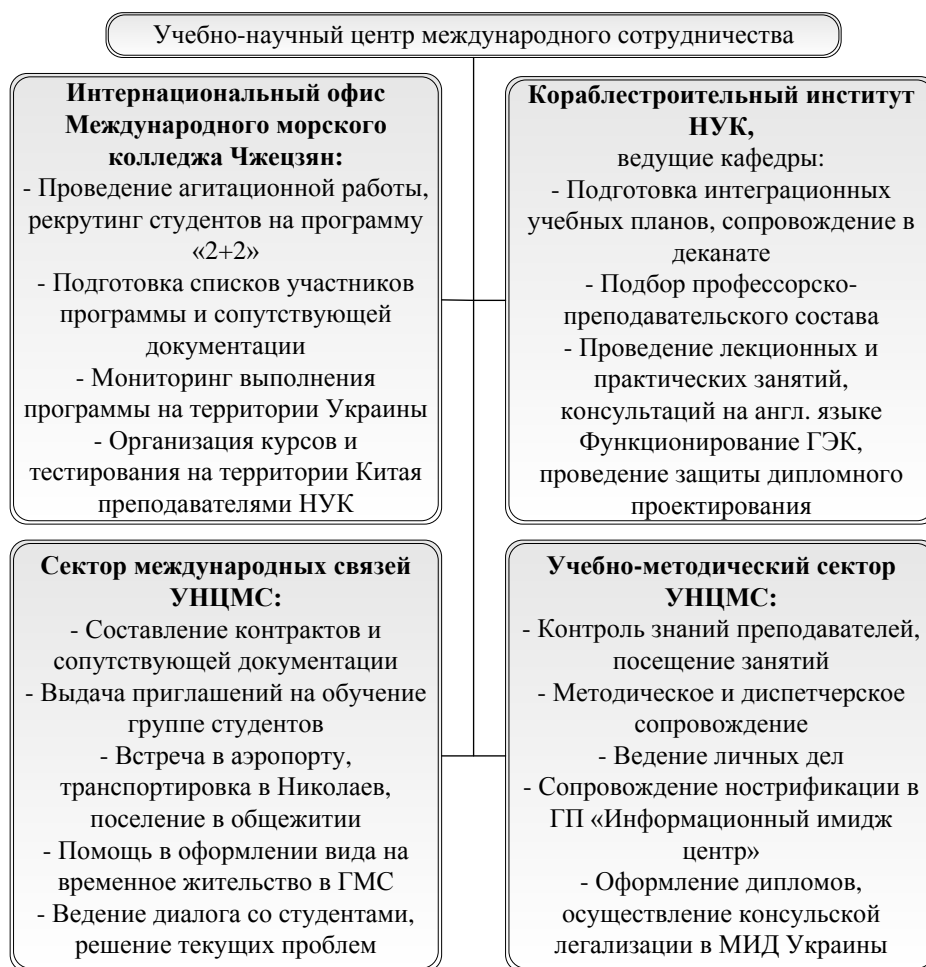
Рис. 2. Секторальное распределение ответственности при управлении проектом учебной программы «2+2»

Как видно из рис. 2, каждое задействованное в программе структурное подразделение несёт ответственность за определённые задачи, которые в сумме дают возможность успешно реализовать проект. Головное подразделение – Учебно-научный центр международного сотрудничества (УНЦМС). По состоянию на июль 2014 года уже было завершено два проекта: две группы выпущены с дипломами бакалавров, общее количество выпускников – 27 человек. В 2015 году осуществлён выпуск 17 новых молодых специалистов. В 2016 выпустилось 22 гражданина Китая. Позитивным побочным продуктом данной программы можно считать продолжение некоторыми выпускниками обучения в магистратуре. Следует отметить, что магистерская подготовка осуществляется на русском языке, поэтому за два года обучения на английском, внимание также уделяется и курсам русского языка.