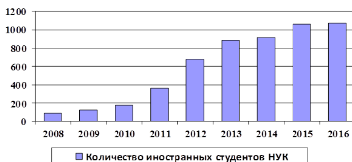
Рис. 1. Количество иностранных студентов в НУК за 2008–2016 годы

рассматривать преподавателя как лицо, стремящееся помочь студенту усвоить необходимые знания и умения, предусмотренные стандартом образования. На основании этого подхода принят расчет количественной оценки качества преподавания [13]. Этот расчет применялся для оценки образовательного процесса для украинских студентов, но для оценки реализации международных учебных программ он применяется впервые [13]. В литературе отсутствуют данные о существовании универсальной вычислительной программы для проведения расчетов количественной оценки качества преподавания [14]. Поэтому для упрощения процесса расчетов была разработана программа на основе пакета прикладных программ MATLAB [15].