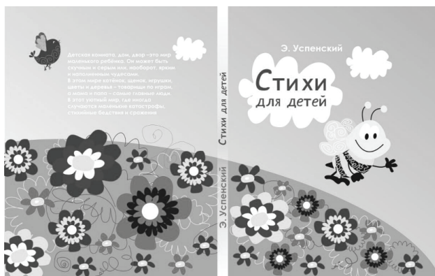
Рис.2. Развертка обложки