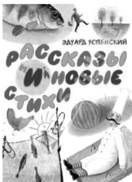
Рис.1. Обложки книг «Стихи для самых маленьких» и «Рассказы и новые стихи»