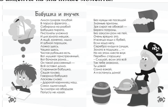
Рис.5. Разворот книги

Два разворота книги представлены на рис.4 и 5. При разработке книги внимание уделялось не только иллюстрациям к тексту, но самому тексту. По тексту делались акценты на значимые моменты.