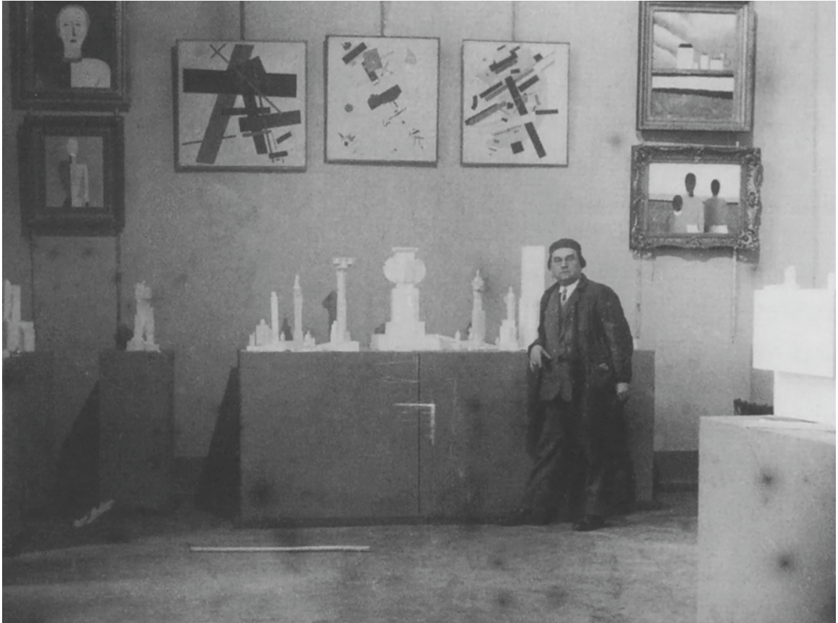
Казимир Малевич на Великій берлінській художній виставці, 1927 р. (Korzyska 2016)

Ідеї та відкриття творців модернізму, зокрема Казимира Севериновича Малевича,