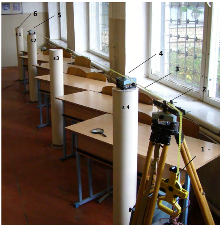
Рис. 1. Вимірювання відстані за допомогою рулетки у першому циклі

4) відкріплення струбцини на стовпчику s1, зсув полотна рулетки на малу величину та закріплення її струбциною до стовпчика s1.