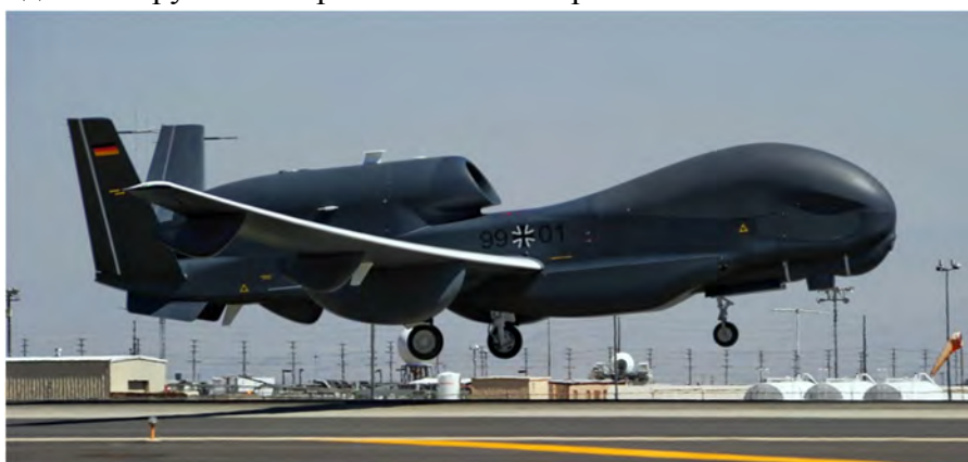
Рис. 1. Стратегічний БПЛА RQ-4 Global Hawk (США)

Оперативні та стратегічні сучасні БПЛА в Україні не випробувались. Як приклад таких апаратів можна навести відомий стратегічний БПЛА виробництва компанії Norman Grumman (США) – RQ-4 Global Hawk (рис. 1). Цей БПЛА оснащений турбогвинтовим двоконтурним двигуном (ТРД) Allison Rolls-Royce AE3007H із тягою 31,4 кН і здатний нести корисне навантаження масою до 900 кг. Для ЗС України у зв'язку з обмеженістю території, на якій проводиться АТО, більший інтерес становлять компактні і мобільні тактичні та оперативно-тактичні безпілотні апарати, які внаслідок незначних габаритів є більш захищеними від ураження стрілецькою зброєю. На рис. 2 наведені деякі приклади конструктивних рішень таких апаратів.