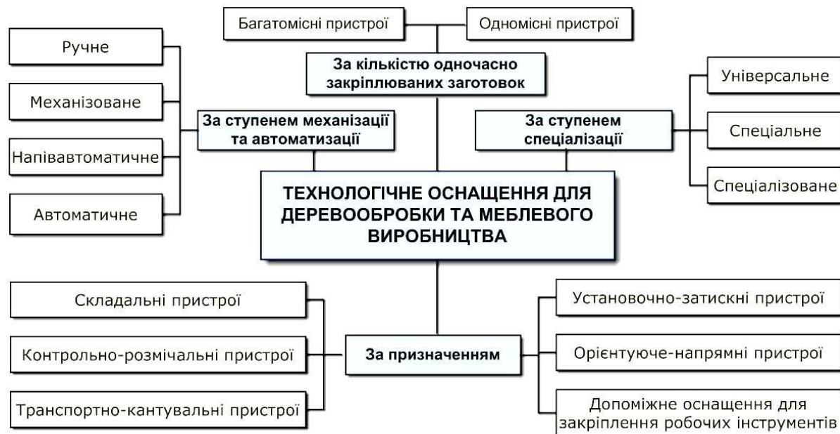
Рис. 1. Класифікація технологічного оснащення для деревообробки

Виклад основного матеріалу. Технологічне оснащення в деревообробці – це пристрої або механізми для ручної, механічної обробки, деформування, складання (склеювання) тощо елементів дерев'яних конструкцій, виробів чи меблів, що забезпечують взаємне орієнтування, сталість положення та закріплення елементів технологічної оброблювальної системи при різних видах обробки або складання виробів із деревини (меблів), доповнюють технологічне деревообробне устаткування або механізований деревообробний інструмент, розширюють їхні технологічні можливості, забезпечують безпеку праці робітника та підвищення продуктивності виконання технологічних операцій. До елементів технологічної оброблювальної системи в деревообробці належать: технологічне обладнання, ручний механізований деревообробний інструмент, дерев'яна заготовка або елементи дерев'яних конструкцій чи меблів при їх складанні. Також до технологічного оснащення відносяться контрольні пристрої та допоміжний інструмент, призначений для закріплення різального інструменту на деревообробних верстатах та механізованому деревообробному інструменті. У цій роботі здійснена перша спроба класифікації технологічного оснащення для деревообробки та меблевого виробництва, яка наведена на рис. 1.