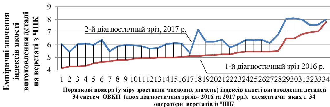
Рис. 4. Порівняльний аналіз рівнів якості виготовлення деталі 34 відкритих змішаних систем ОВКП, оператори яких пройшли державну атестацію

У результаті порівняння абсолютних величин емпіричних значень індексів якості виготовлення деталі інформаційних технологій забезпечення функціонування 34 відкритих змішаних систем 2-го діагностичного зрізу (2017 р.) з 1-м (2016 р.) фіксується значне зростання індексу якості виготовлення деталі на – 1,08.